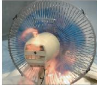
コンデンサーから発煙し、発火しました

約36年の長期使用により扇風機の部品が劣化してショートしたため、発火したものです。