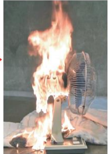
炎で溶けた樹脂が布団に落ち燃え広がりました 【NITEの再現実験】