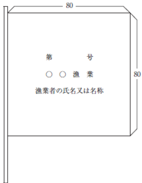
様式第 4 号(第59条関係)