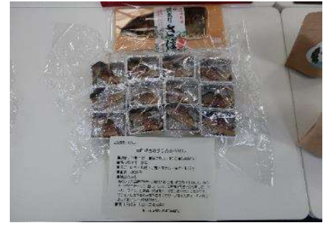
1003 三陸燻香あぶりさば(桜燻し) 大弘水産株式会社