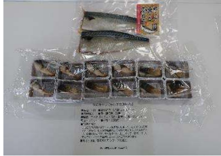
1002 桜のチップで燻した三陸塩さば 株式会社サンフーズ気仙沼