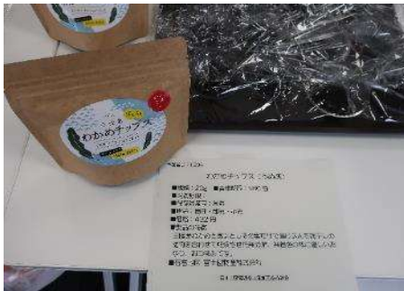
1004 わかめチップス(うめ味) 富士國物産株式会社