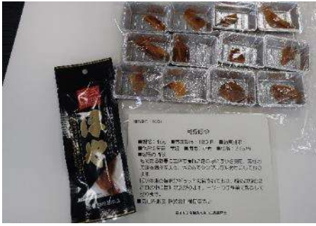
1001 乾燥ほや 株式会社横田屋本店