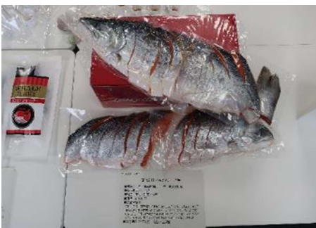
1010 甘塩銀鮭一尾姿切身 2号 株式会社塩釜水産食品