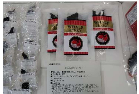
1009 くじらのジャーキー 有限会社マルキチ阿部商店