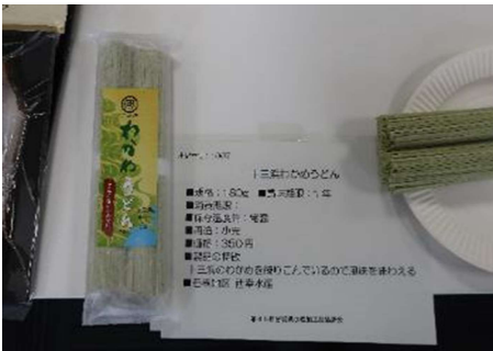
1007 十三浜わかめうどん 西幸水産