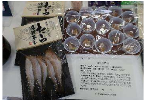
1006 たら味醂干し 株式会社林正