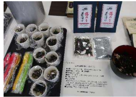
1005 石巻金華茶漬(梅のり) 富士國物産株式会社