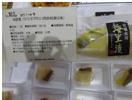
4011 海里漬 (からすがいい西京粕漬切身) 株式会社御前屋