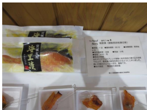
4013 海里漬(銀鮭西京粕漬切身) 株式会社御前屋