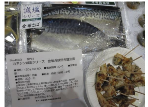
4003 カネシン減塩シリーズ 金華さば昆布醤油漬 株式会社カネシン