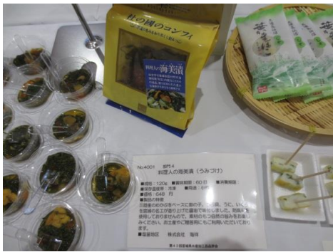
4001 料理人の海美漬(うみづけ) 株式会社 海祥