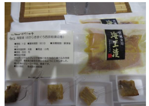
4012 海里漬 (めかじきまぐろ西京粕漬切身) 株式会社御前屋