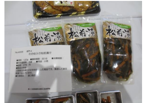
4006 わかめ入り松前漬 瀧口商店