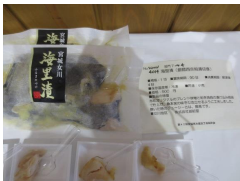
4014 海里漬(銀鮭西京粕漬切身) 株式会社御前屋