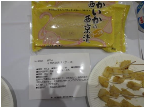
4004 イカ西京漬(チーズ) 株式会社西抜商店