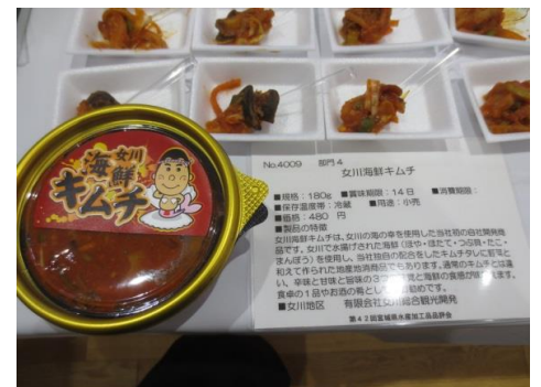
4009 女川海鮮キムチ 有限会社女川総合観光開発