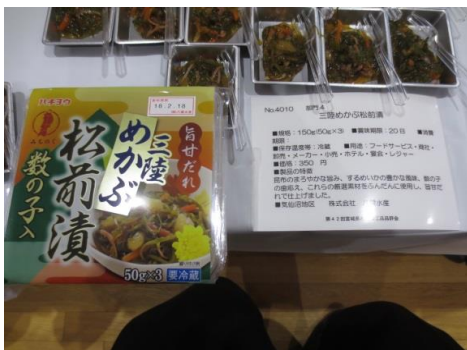
4010 三陸めかぶ松前漬 株式会社 八葉水産