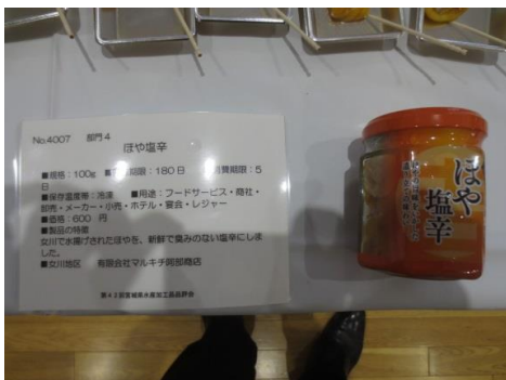
4007 ほや塩辛 有限会社マルキチ阿部商店