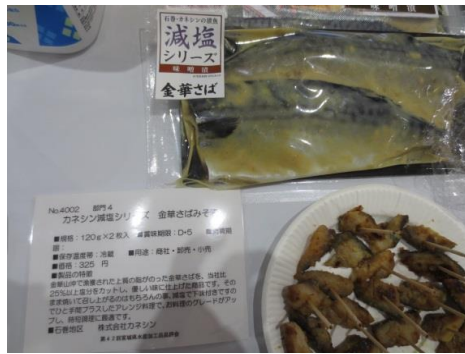
4002 カネシン減塩シリーズ 金華さばみそ漬 株式会社カネシン