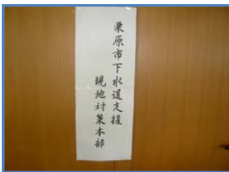
現地対策本部での作業状況