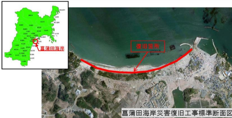
「空中写真データ」(国土地理院) ( http://mapps.gsi.go.jp/maplibSearch.do#1 ) をもとに宮城県仙台土木事務所作成