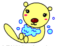
仙南保健所オリジナルキャラクター「てあらっこ」

第9週現在、インフルエンザ、A群溶血性レンサ球菌咽頭炎が警報レベルを継続中です。