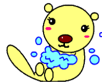
仙南保健所オリジナルキャラクター 「てあらっこ」

1類感染症：報告なし 2類感染症：結核 男性1名、女性1名 3類感染症：報告なし 4類感染症：報告なし 5類感染症：報告なし