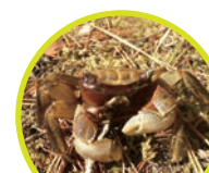
クロベンケイガニ