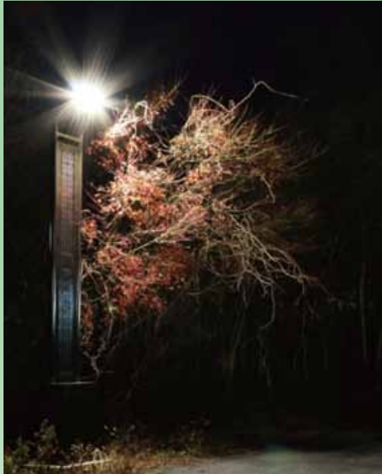
■公園の夜間照明風景