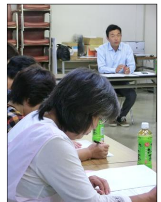
加工機器と食品表示の講義の様子

研修では、これから農産加工に挑戦した3名の方が新たに参加し、被災地での復興・再生への高い意欲を感じることができました。