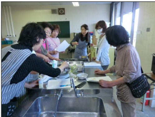
パウンドケーキ試作の様子

6次産業化における農産加工について、ジャムや漬物などのような生産者が作りやすい加工品ではなく、消費者の購買意欲を高める高付加価値の商品の開発が求められています。