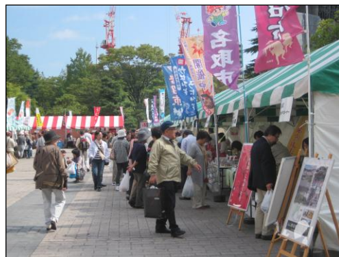
秋晴れの空の下、にぎわう会場

両日とも天気にも恵まれ、2日間を通じた来場者数は昨年を上回る約15,000人となり、出店者が自慢のグルメをPRしながらお客さんとやりとりをする様子が各店舗で見られ、にぎやかなイベントとなりました。