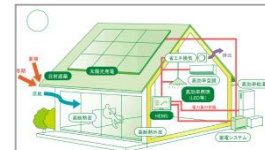
資源エネルギー庁ウェブサイト ( https://www.enecho.meti.go.jp/category/saving_and_new/saving/general/housing/index03.html )

●事業概要 【予算額 272,000千円】 家庭部門のCO 2 排出量の削減及び災害時のエネルギーの自立を図るため、化石燃料消費量の削減や、エネルギー自立性の向上に資する設備や工事の経費を補助します。 (対象設備) ①太陽光発電、②地中熱ヒートポンプ、③蓄電池、④V2H、⑤エネファーム、⑥省エネ改修