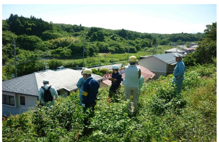
富谷市仏所(急傾斜地崩壊)