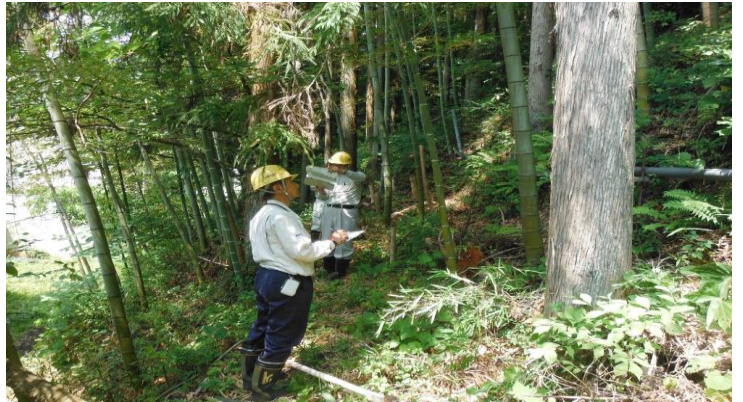
登米市津山町横山(急傾斜地崩壊)