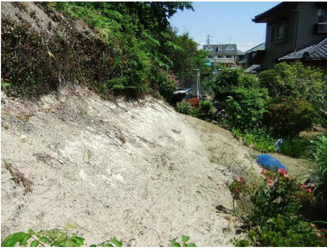
亙理町逢隈(急傾斜地崩壊)