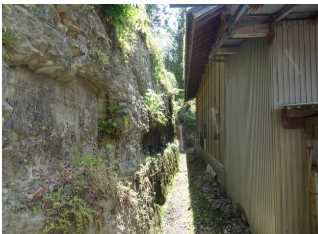
角田市阿弥陀入(急傾斜地崩壊)