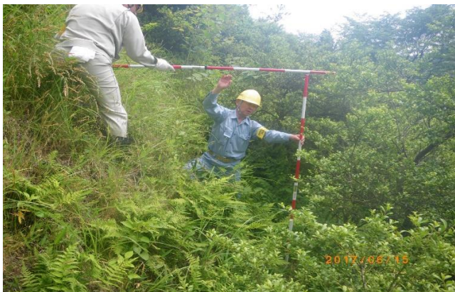
栗原市南郷原(急傾斜地崩壊)