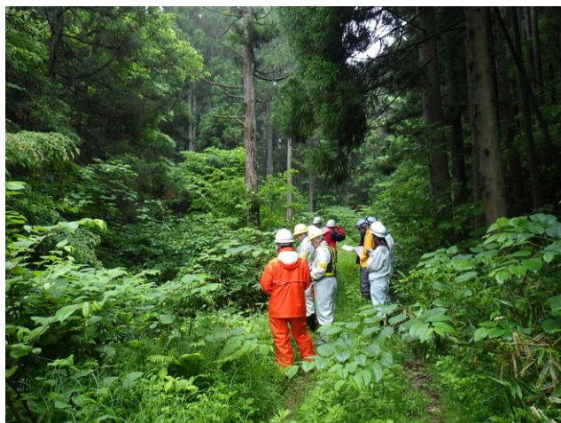
大崎市三本木待井東(土石流)