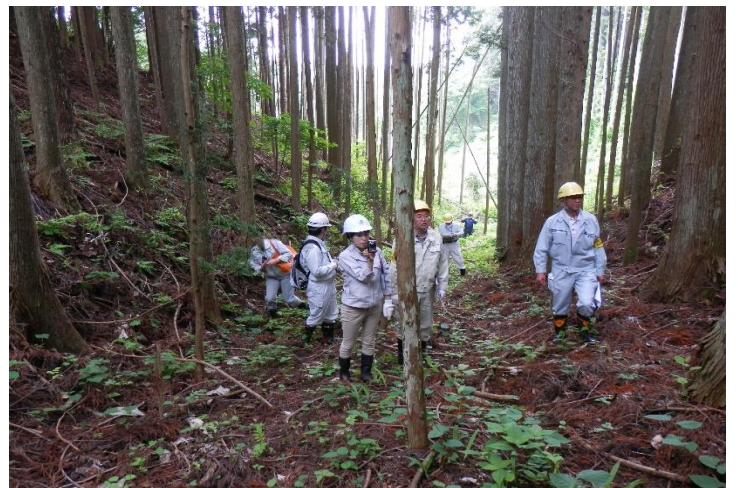
南三陸町歌津寄木(土石流)