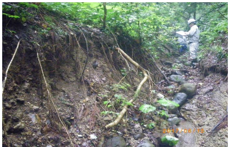
栗原市早坂(土石流)