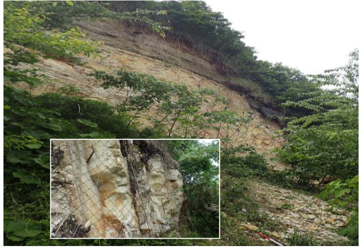
大崎市三本木天王沢(急傾斜地崩壊)