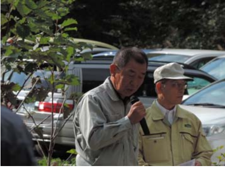
堀砂防ボランティア協会長