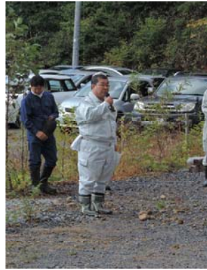
三浦栗原地域事務所長