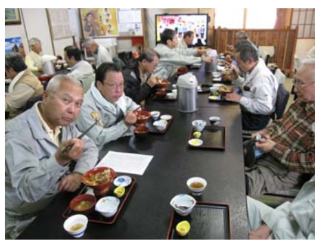
名物「いわな丼」に舌鼓