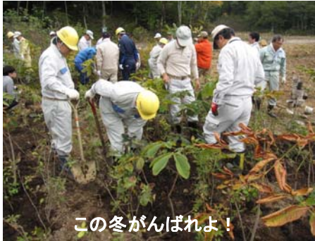
この冬がんばれよ！