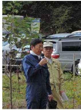
菅原プロジェクト代表