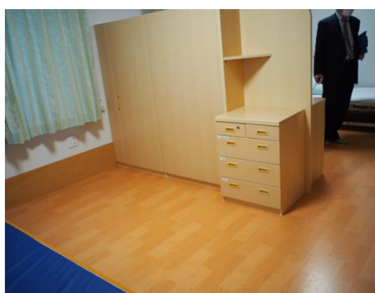
最近の施設事例（左：個室，右：家具等で仕切った2部屋）