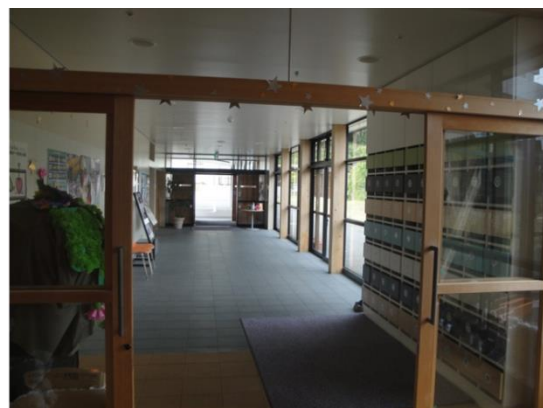
最近の施設事例 (左：廊下, 右：玄関)