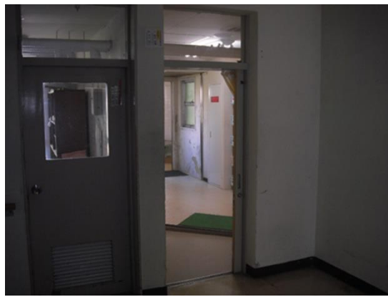
現施設：おおくら園の事例 (左：廊下に最大90cmの段差, 右：脱衣所)