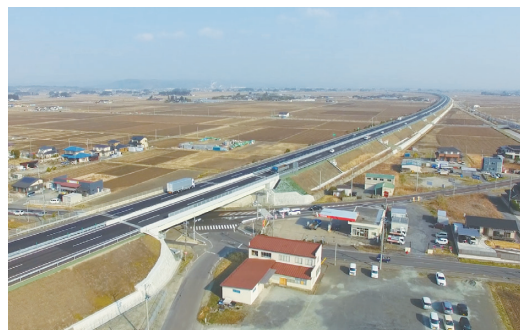
●常磐自動車道(山元IC～亶理IC間)