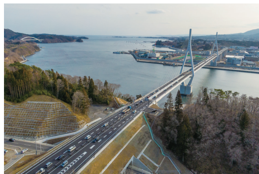
●気仙沼道路(気仙沼港IC～浦島大島IC間)