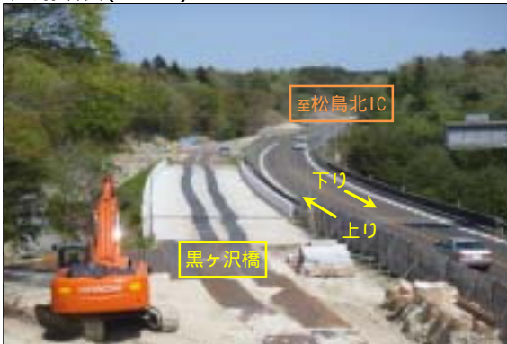
切土作業中 排水工施工中