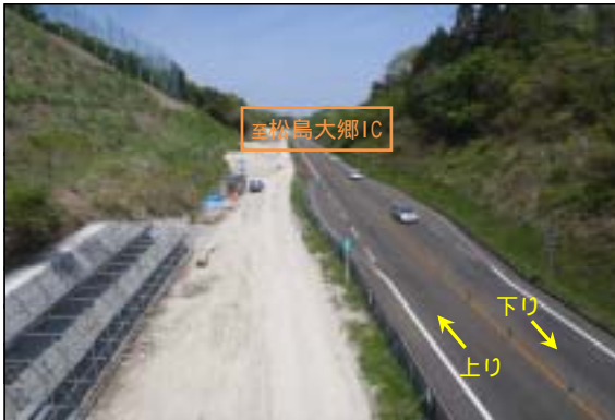
切土・ブロック積擁壁完了 中央分離帯 重力式擁壁施工中