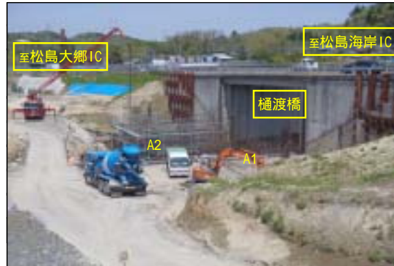
A1橋台 フーチング完了 A2橋台 フーチング施工中