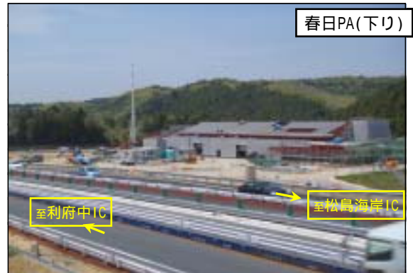
施設建築工事:鉄骨建方完了、屋根・外壁施工中