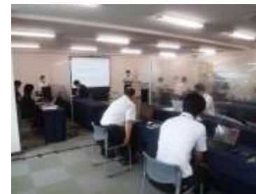
(事業3：森林作業道作設オペレーター養成研修)