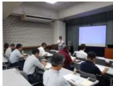
(事業1：マネジメント研修)