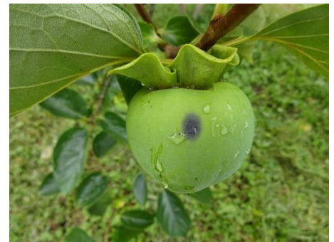
炭そ病が発病した果実