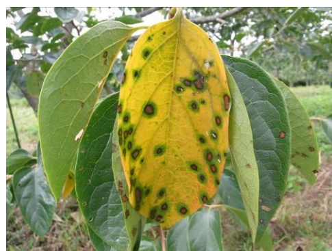
円星落葉病の秋の病斑