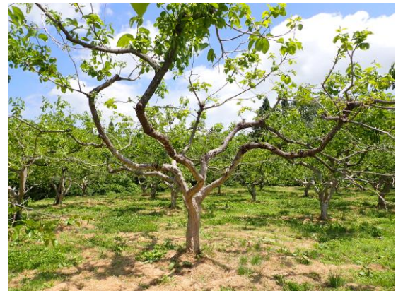
凍霜被害の大きい樹 6月中旬の様子 新梢が遅れて発生し、新梢数も少ない。

また、枝は、日光が当たり必要な葉が確保できれば伸長が止まります。したがって、徒長枝を間引き、日当たりをよくして、新梢の伸長を止めて充実した結果母枝を育成します。