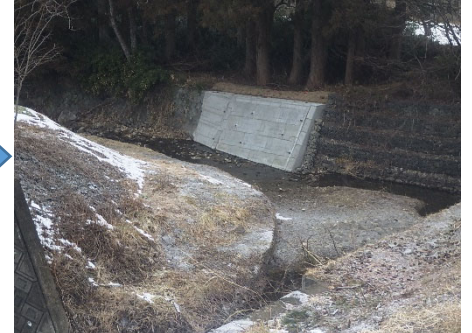
丸森町 雉子尾川 111号