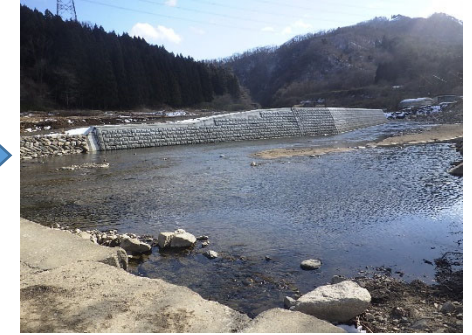
丸森町 雉子尾川 113号