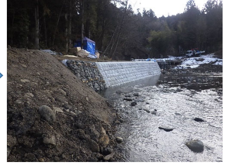
丸森町 雉子尾川 117号