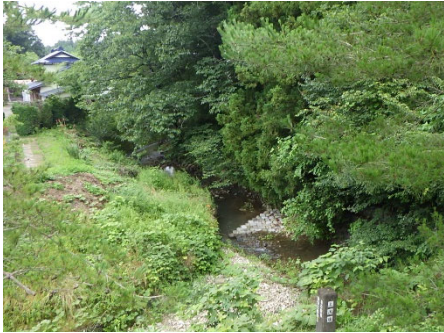
角田市 桜井川 91号