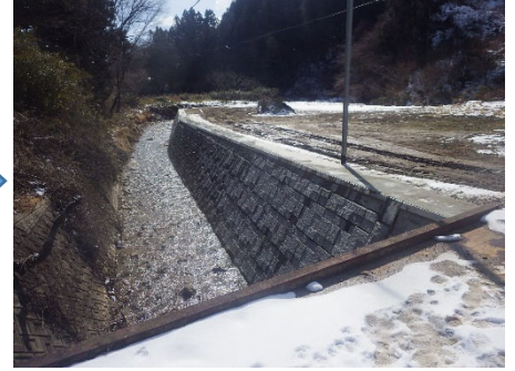
白石市 斎川 176号