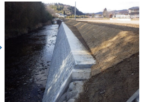
角田市 小田川 158号