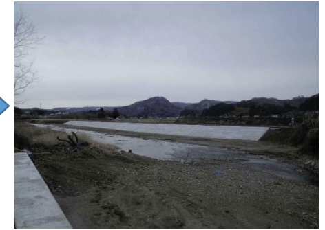
丸森町 雉子尾川 112号