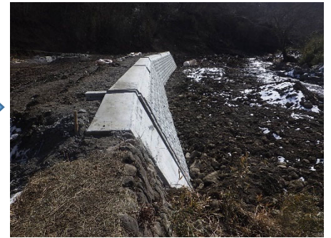
村田町 新川 124号