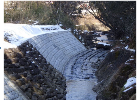
白石市 谷津川 184号