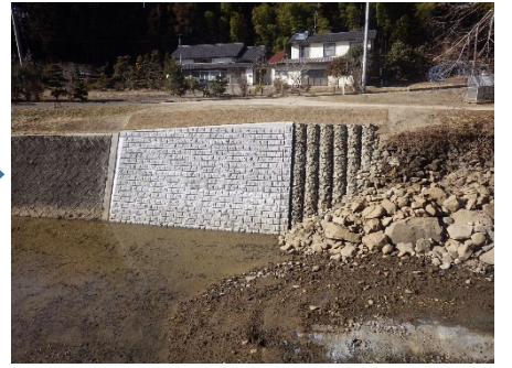
村田町 新川 126号