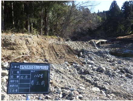
丸森町 雉子尾川 115号