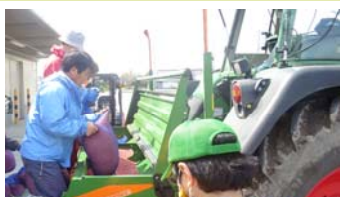
乾田直播種籾投入状況(H28.4)