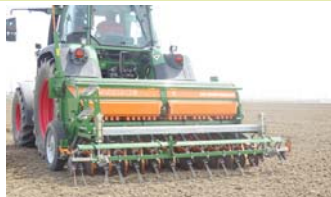
グレーンドリル播種状況(H28.4)