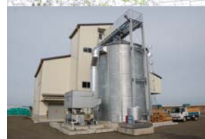
ライスセンター竣工(H25.12)