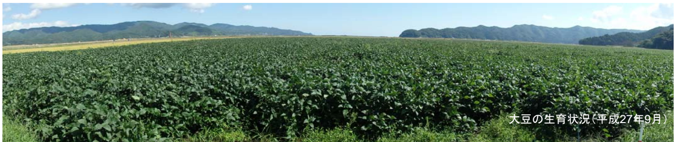
大豆の生育状況(平成27年9月)