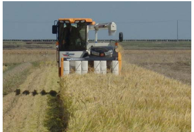
試験田稲刈りの様子(平成26年10月)