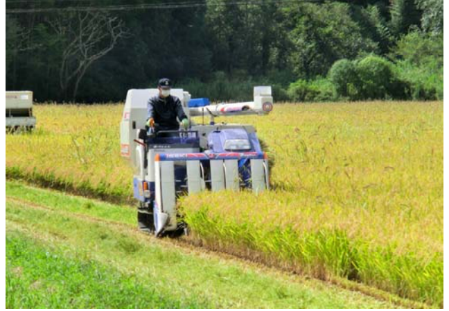
3年ぶりの収穫作業(平成25年9月)