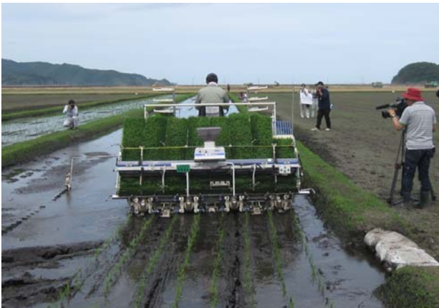
試験田田植えの様子(平成26年6月)

大川地区長面工区では平成27年度からの一部営農再開に向け、復旧農地における塩害対策等の課題を抽出し、今後の復旧対策に反映させるため、試験研究機関等と連携し、試験ほ場(24a)に水稻の作付けを行いました。