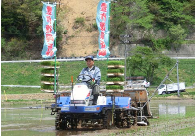
3年ぶりの田植え作業の様子(平成25年5月)