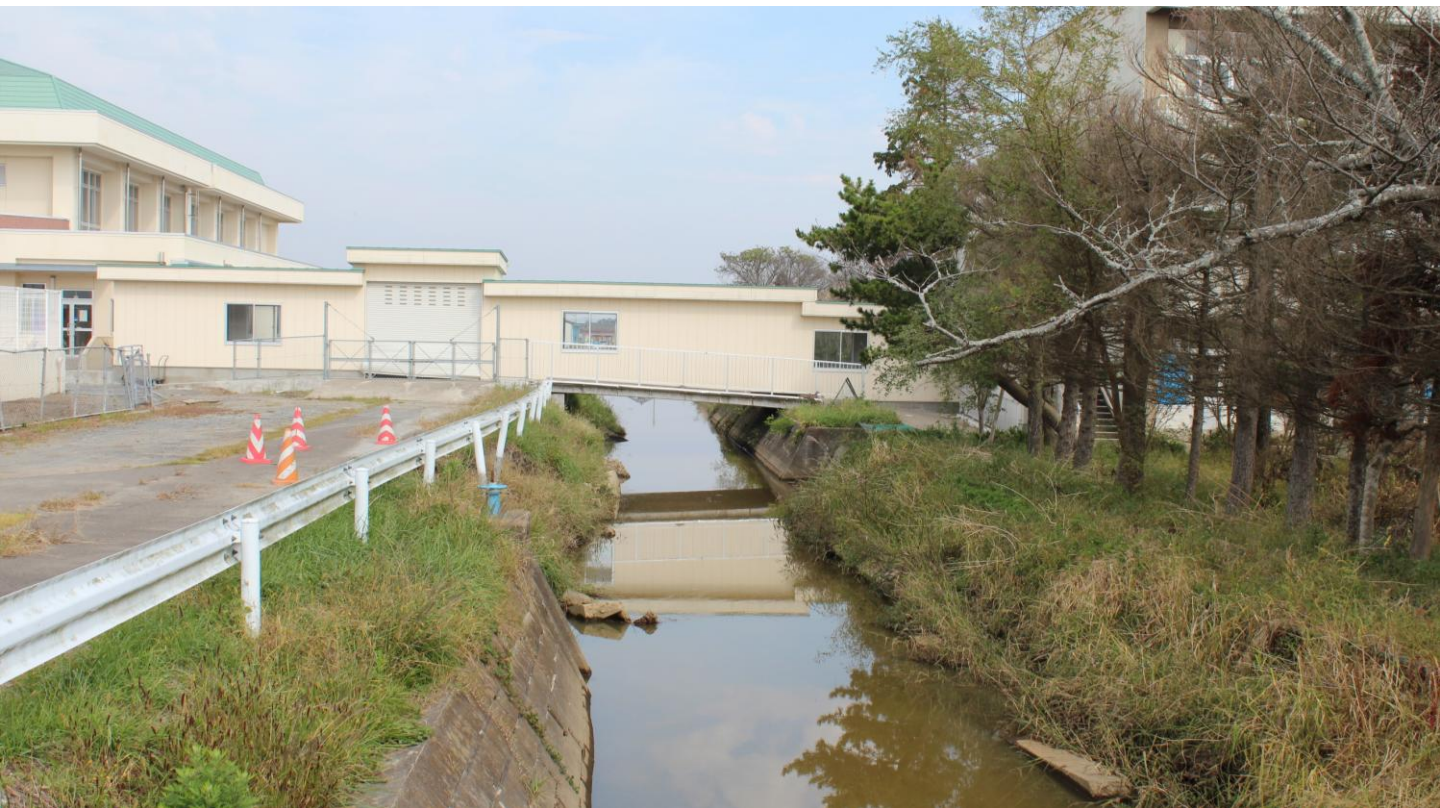
ガレキ撤去後（平成23年10月10日）

震災による津波で被災した農業用幹線排水路について、緊急応急工事として、名取市外6市町において、東北農政局が延長27.02 km（26路線）、県農林水産部が延長80.5km（57路線）のガレキ撤去を行い、平成23年8月末に作業を完了しました。