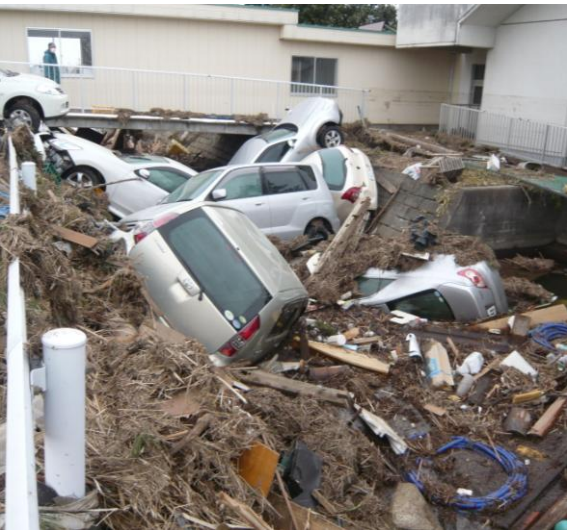
被災直後（平成23年3月21日）