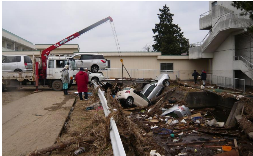
ガレキ撤去作業（平成23年3月21日）