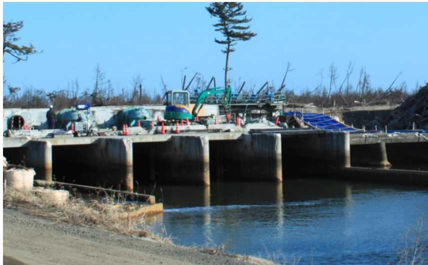
機場復旧工事（平成24年3月14日）