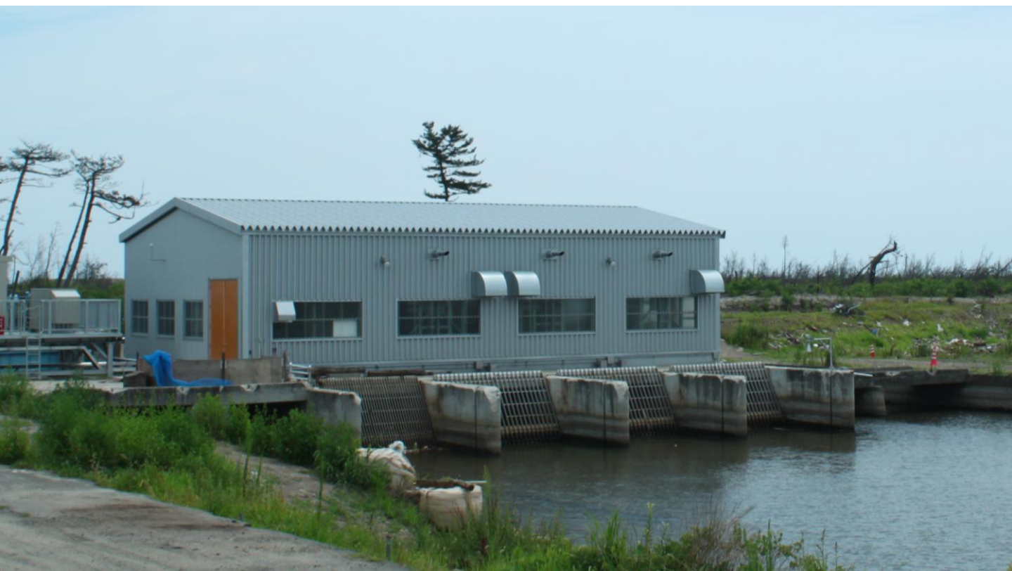
仮復旧された建屋（平成24年9月20日）

宮城県内の農業用排水機場復旧対象施設47施設のうち、平成25年9月末現在で37施設の復旧に着手し、17施設が完了しています。応急復旧により、従前と比較し全体の8割の排水能力を回復しています。