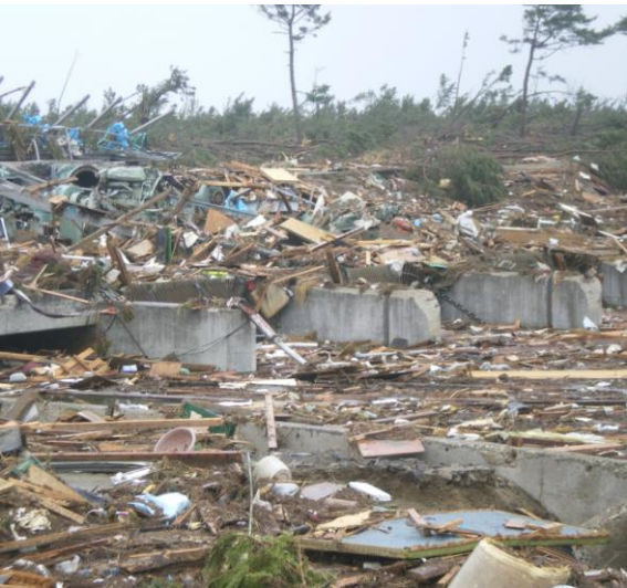
被災直後（平成23年3月15日）