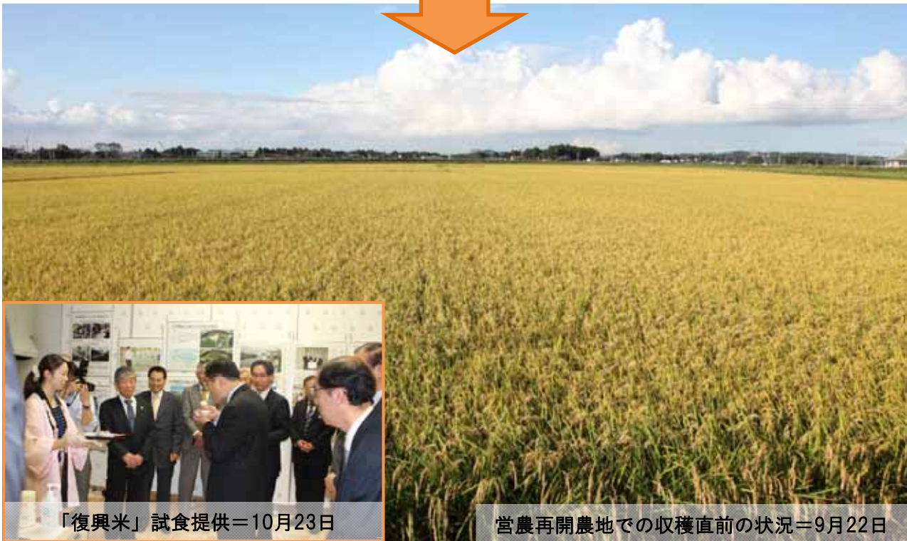
営農再開農地での収穫直前の状況＝9月22日