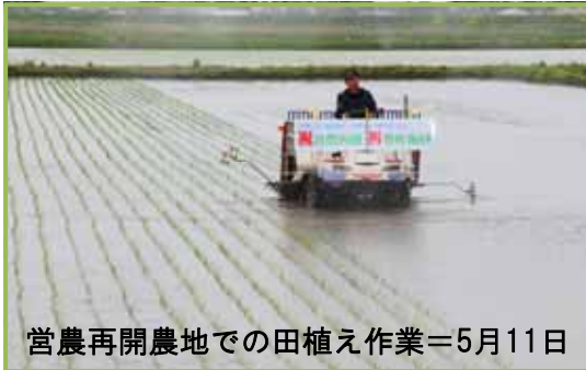
営農再開農地での田植え作業＝5月11日