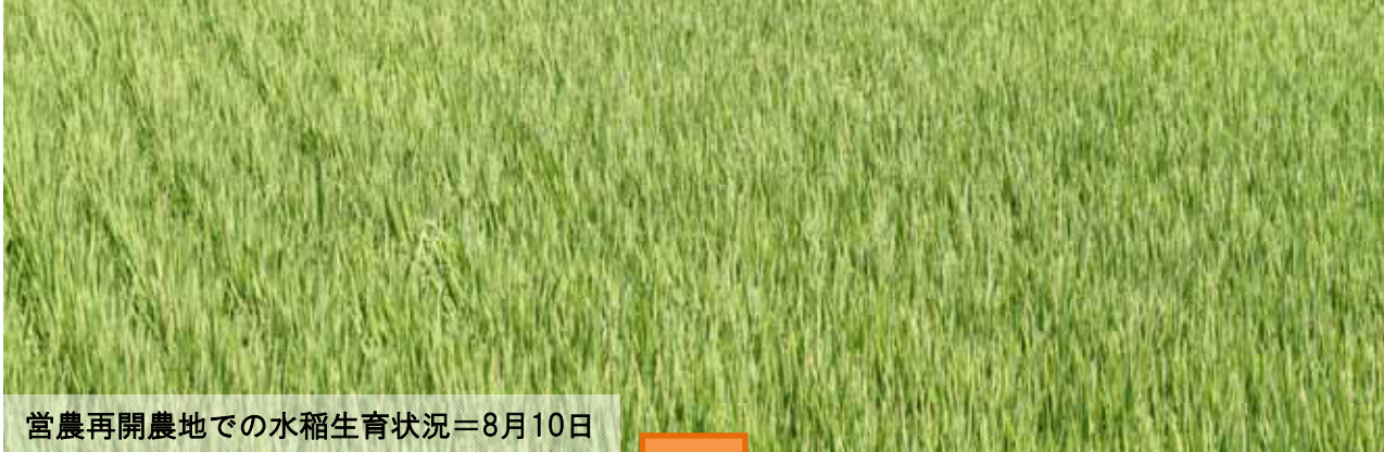
営農再開農地での水稻生育状況＝8月10日