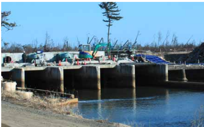
機場復旧工事(平成24年3月14日)