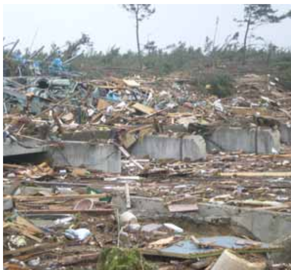
被災直後(平成23年3月15日)