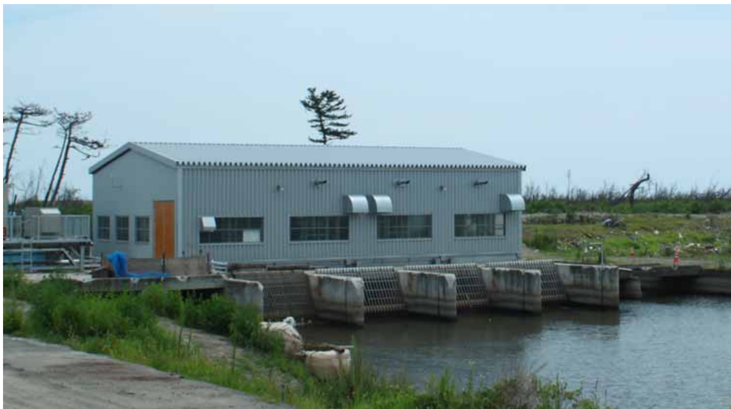
仮復旧された建屋(平成24年9月20日)

宮城県内の農業用排水機場復旧対象施設49施設のうち、平成23年度は4施設が復旧し、平成24年度は平成25年1月末現在で27施設の復旧に着手しています。なお、機場の応急復旧により、既に全体の8割の排水能力を回復しています。