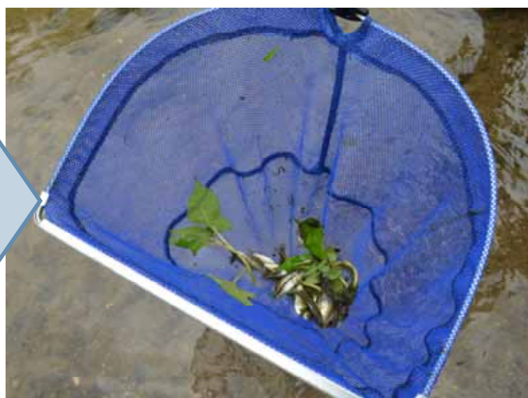
海水が進入した水路に戻った魚