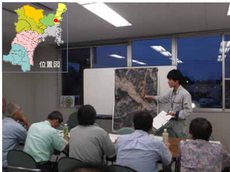
集落説明会での説明 (説明者: 鹿児島県派遣)