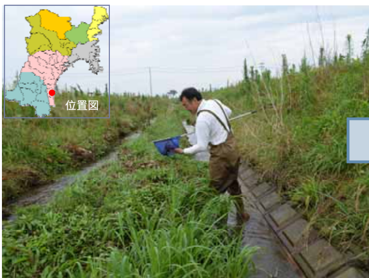
水路での生き物調査状況