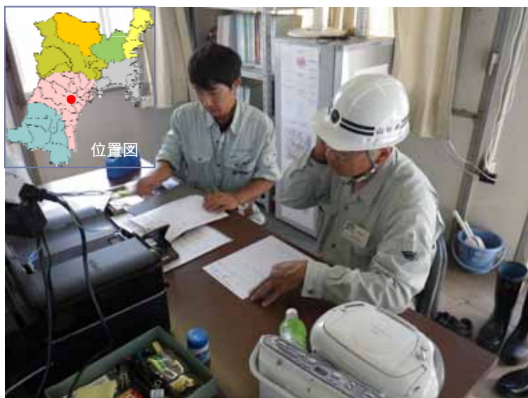
工事の管理 (山形県派遣)