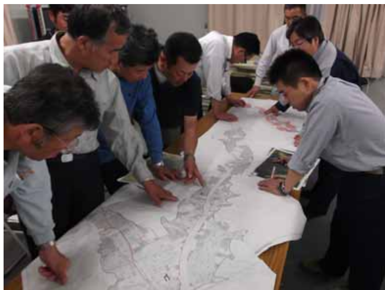
集落説明会での説明 (右から1番目: 鹿児島県派遣)