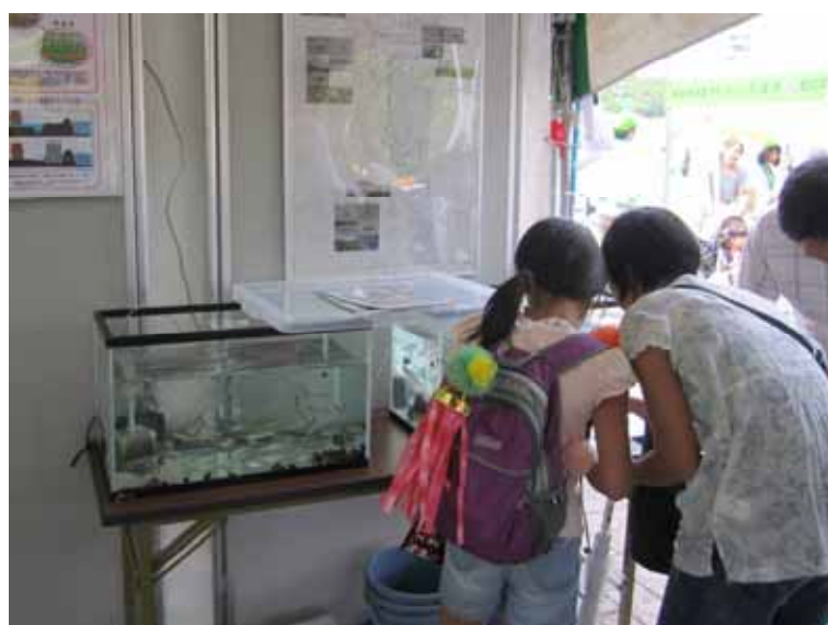
展示された生き物を見る来場者 (仙台市)

津波により海水が浸水した区域にも、少しずつ田んぼの生き物たちが戻ってきています。被災区域の生き物復元状況を知って頂くため、震災で大きな被害を受けた亘理土地改良区管内で捕獲されたザリガニや各種生き物を、平成24年8月6日から8日に開催された仙台七夕まつりで展示しました。