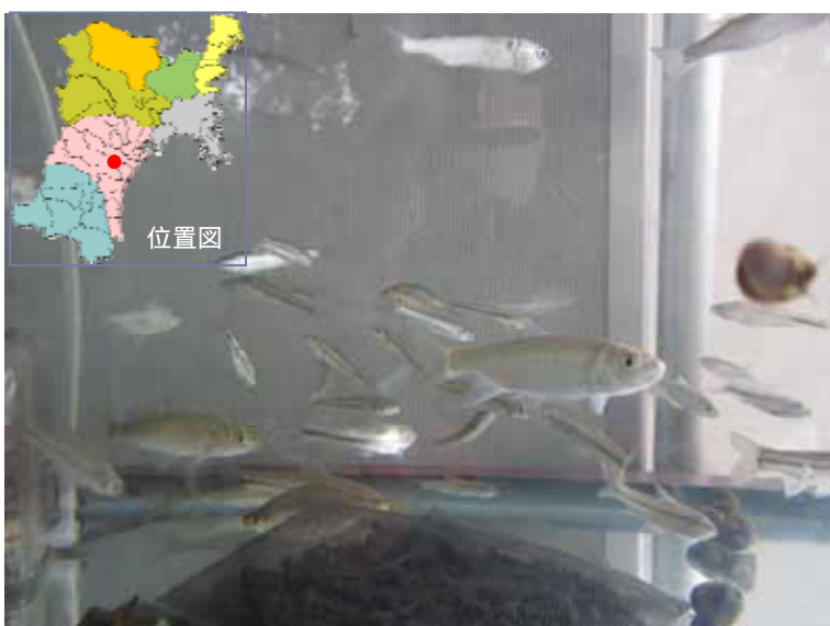
仙台七夕まつりでの生き物展示 (仙台市)