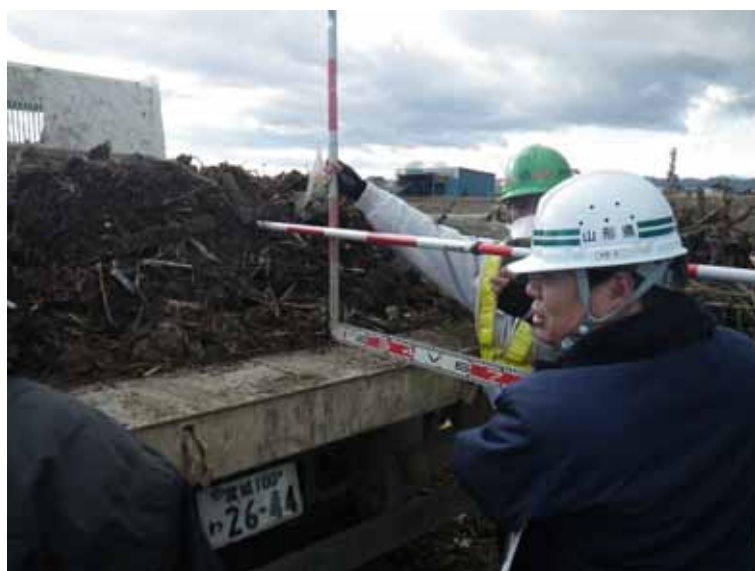
工事の管理 (右から1番目: 山形県派遣)

今回の震災により、宮城県では被害調査や応急復旧に対応するための農業土木専門職員が大幅に不足したため、震災直後から山形県を始めとして、28都道県から技術職員を派遣していただいています。