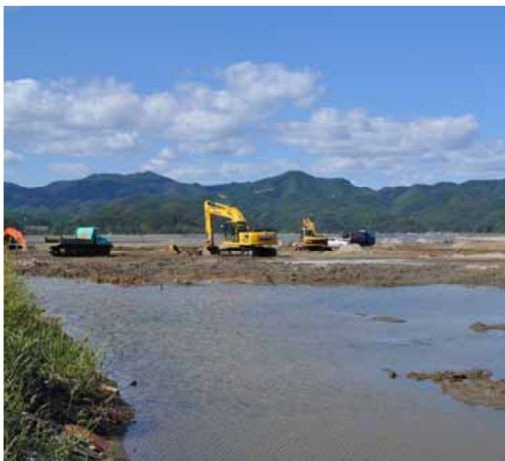
干陸化が始まり重機が入った様子(平成24年9月26日)