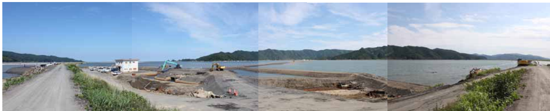
平成24年7月20日(排水開始前)