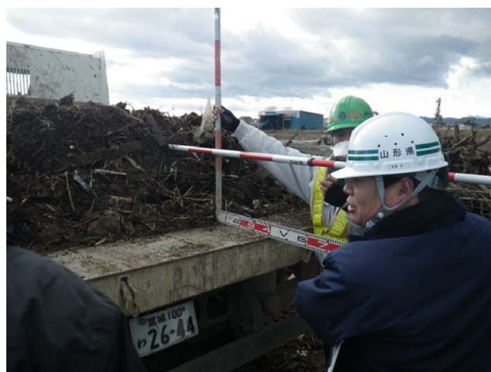
工事の管理①(山形県派遣)