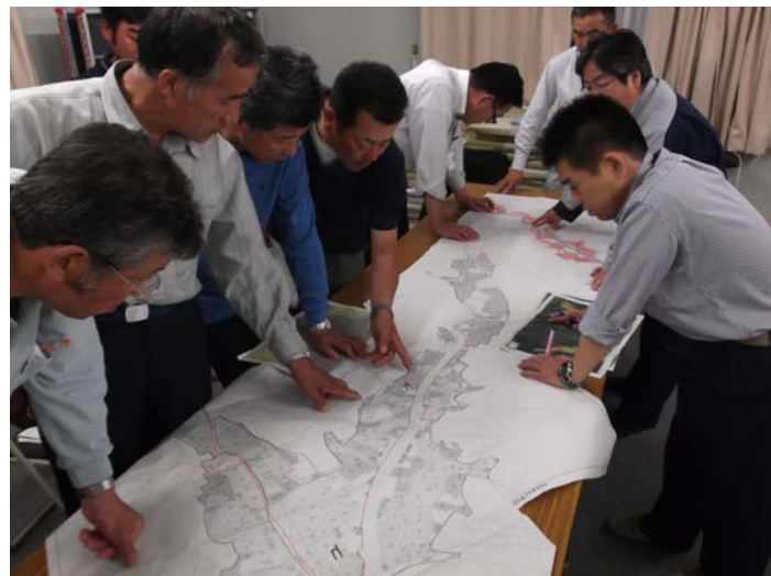
集落説明会での説明① (説明者: 鹿児島県派遣)