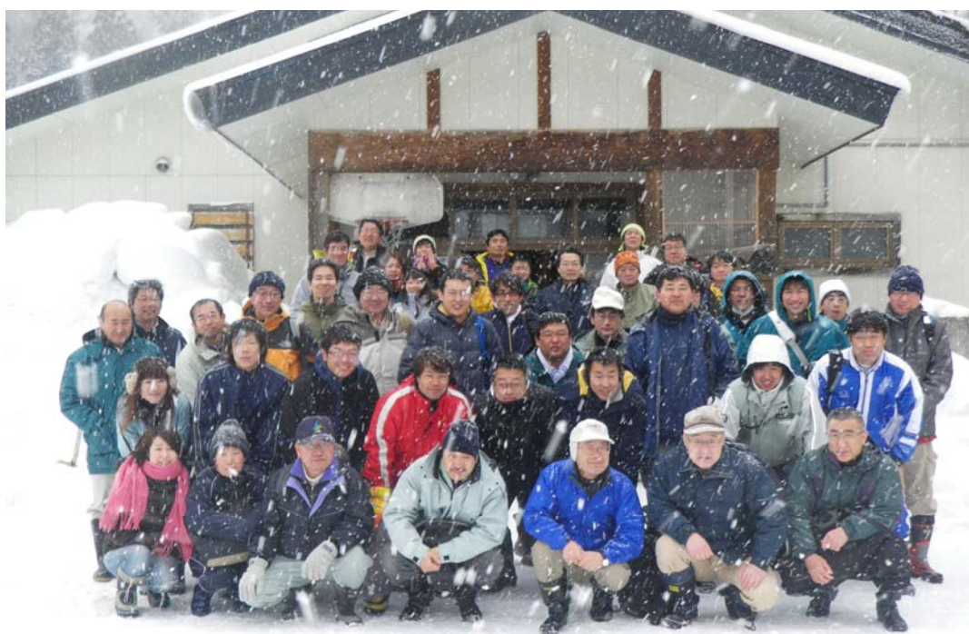
除雪ボランティア への参加 (七ヶ宿町)