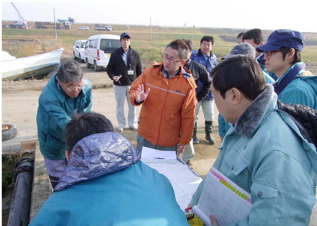
東部地方振興 事務所