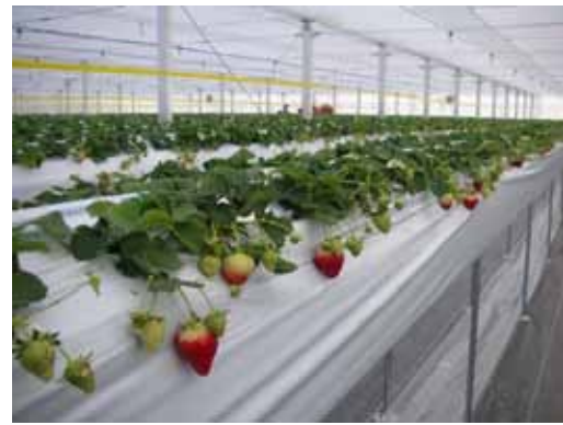
▲写真 イチゴ生産状況