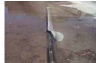
▲写真 県営災害復旧事業 秋山頭首工ゴム堰破損状況(栗原市)