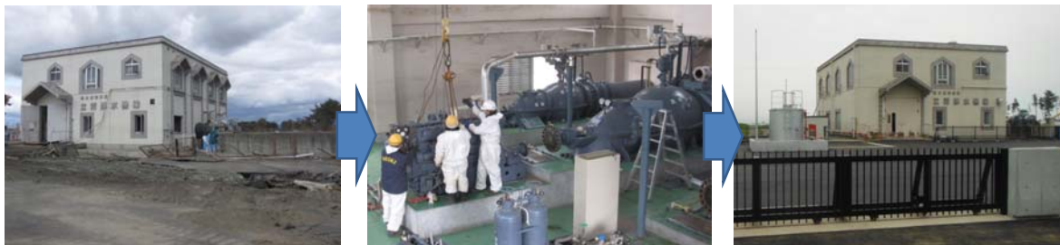
▲写真 県営災害復旧事業(施設)中下排水機場地区被災(左)・応急復旧(中)・復旧後(右)(東松島市)