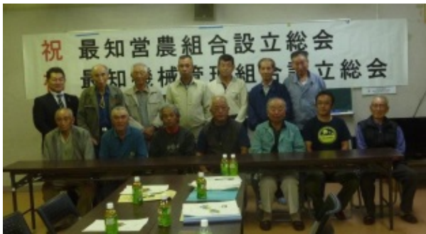
▲写真 最知営農組合設立（気仙沼市）