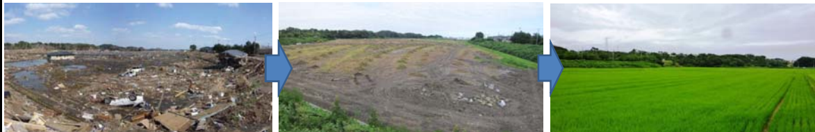
▲写真 県営災害復旧事業(農地)下田地区(七ヶ浜町)