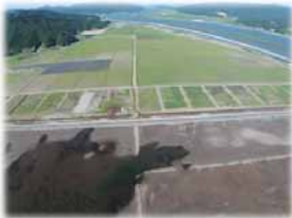
▲写真 長面工区一部試験作付け (H27年7月)

このような中、7戸9名の担い手農家有志が立ち上がり、新たに「株式会社宮城リスタ大川」（農業生産法人）を平成25年5月に設立し、210ha規模の農地利用を見込んでおり、農業生産法人を主体として、被災地域農業復興総合支援事業（被災地リース事業）により、石巻市が導入した農業機械・施設を借り受け、土地利用型作物と園芸作物（きく）を組み合わせた複合経営に取り組むなど、新たな地域農業の生産体制構築と雇用の創出につながっている。