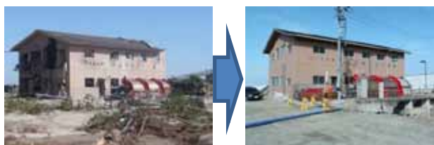
▲写真 県営災害復旧事業 花笠第二排水機場復旧前後

仙台地方振興事務所管内（以降「仙台管内」とする。）では、津波被害のあった農用地 8,390ha、うち仙台市の約 2,000ha は直轄農用地災害復旧関連区画整備事業「仙台東地区」で実施し、山元町他 7 地区約 6,130ha は県営や団体営の除塩事業及び農地災害復旧事業を実施している。