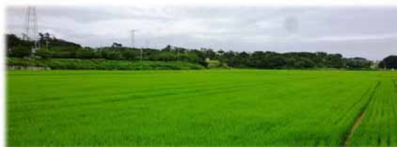
▲写真 営農状況（H28年7月）