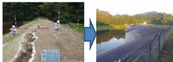
▲写真 県営災害復旧事業（ため池）烏谷地区 加美町 被災前後