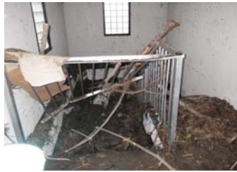
◀写真 災害関連農村生活環境施設復旧事業 井土地区被災状況(仙台市)