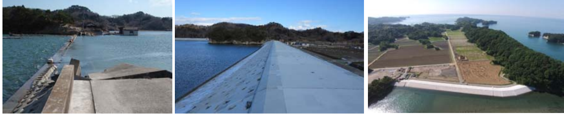
▲写真 県営農地海岸復旧事業 宮戸地区被災（左）・復旧後（中）・背後地復旧状況（右）（東松島市）