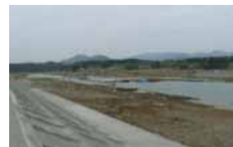
▲写真 県営農業用施設災害復旧事業 十郎衛門頭首工被災状況 気仙沼市