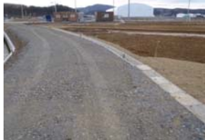
▲写真 波伝谷地(南三陸町)