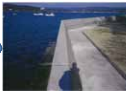
▲写真 県営農地海岸復旧事業 波伝谷地区被災(左)・復旧後(右)(南三陸町)