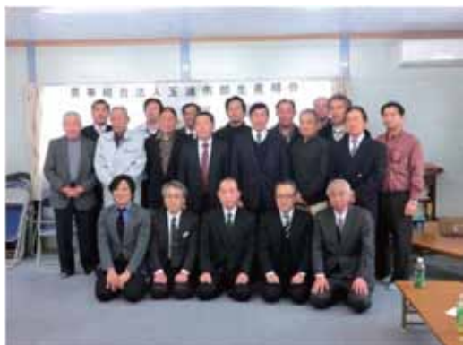
▲写真 玉浦南部生産組合（岩沼市）