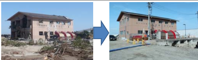
▲写真 県営災害復旧事業(施設)花笠第二排水機場地区被災(左)・復旧後(右)(山元町)