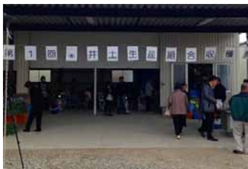
▲写真 井土生産組合（仙台市）