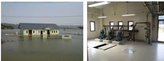
▲写真 団体営農村生活環境施設復旧事業 中道地区被災状況(左)・復旧後(右) (石巻市)