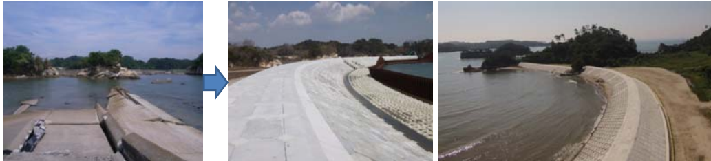
▲写真 農地海岸災害復旧事業 本屋敷海岸被災状況(左)・復旧後(中、右)(松島町)