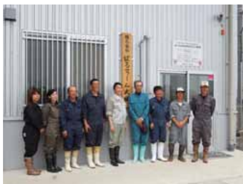
▲写真 パルファーム大曲（東松島市）