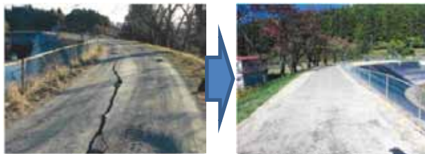
▲写真 県営災害復旧事業 内町下ため池被災前後

大河原地方振興事務所管内（以降「大河原管内」とする。）では、地震被害によって農地復旧が 7 地区、農業用施設 94 地区、集落排水施設で 10 地区の災害査定申請があった。いずれの地区も平成 28 年 8 月末現在で全て完了している。