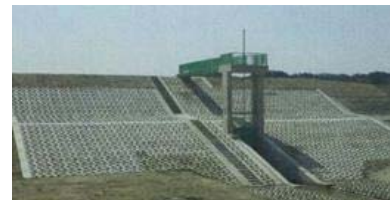
▲写真 不來内揚水機吐き出し樋管完成(松島)