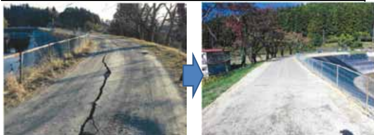
◀ 写真 県営災害復旧事業 内町下ため池 被災(左)・復旧後(右) (角田市)