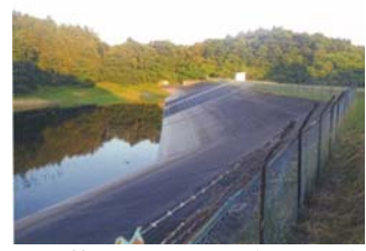
▲写真 県営災害復旧事業(ため池)烏谷地区被災状況(左)・復旧後(右)(加美町)