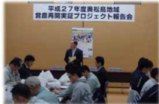
▲写真 平成27年度奥松島地域 営農再開実証プロジェクト報告会