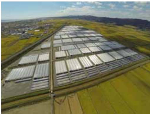
▲写真 大規模イチゴ団地（亶理町）