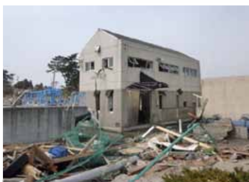
▲写真 被災状況（H23年3月）