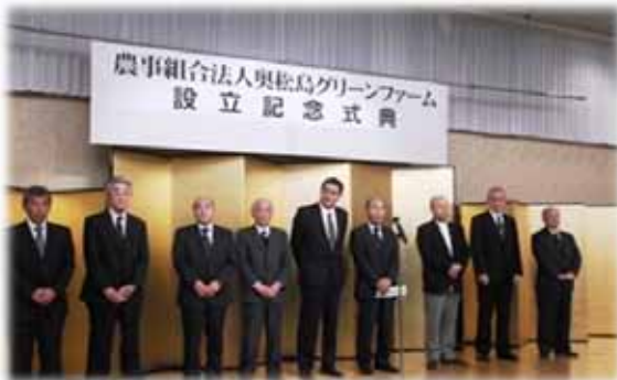
▲写真 奥松島グリーンファームの皆様 (H27年3月)

地区内では「農事組合法人奥松島グリーンファーム」や宮戸の農地をイチジク等の果樹園に活用する「奥松島果樹生産組合（宮戸ふるさと水と土保全隊）」の組織が設立されている。