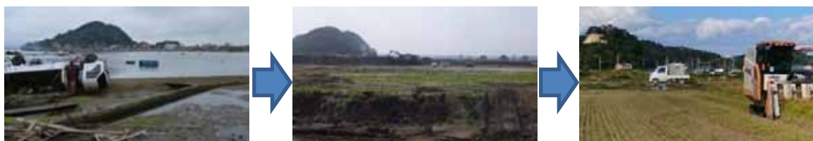
▲写真 県営災害復旧事業（農地）奥松島地区 東松島市（左：被災状況 中央：復旧状況 右：復旧後稲刈り）

東部地方振興事務所管内（以降「東部管内」とする。）では、津波被害のあった農用地3,480ha、120地区は県営や団体営の除塩事業及び農地災害復旧事業を実施している。