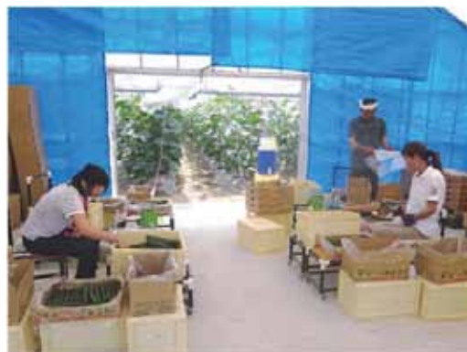
▲写真 キュウリの収穫選別（岩沼市）