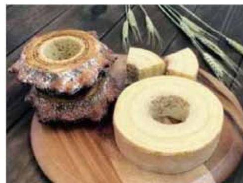
▲写真 バウムクーヘンの製造販売