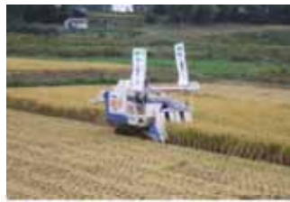
▲写真 沖ノ田地区復旧状況 気仙沼市

気仙沼地方振興事務所南三陸支所管内（以降「南三陸管内」とする。）では、津波被害のあった農用地1,130ha、88地区は県営で除塩事業及び農地災害復旧事業を実施している。