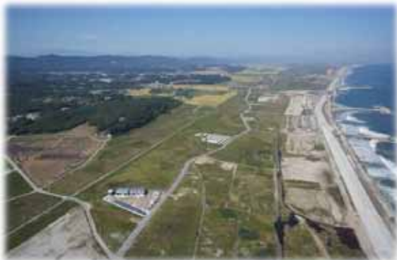
▲写真 山元東部地区 工事着手前(H27 年 9 月)