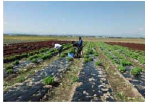
▲写真 井戸地域（仙台市）レタス栽培（仙台市）※

（※参考：平成 27 年 2 月 vol.289/No.11 フォローアップニュースより