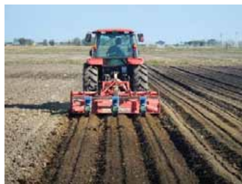
▲写真 大曲地域（東松島市）大豆播種状況