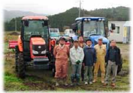
▲写真 株式会社宮城リスタ大川の 皆様