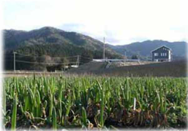
▲写真 南三陸地区 ねぎ作付け状況 (H28年3月)