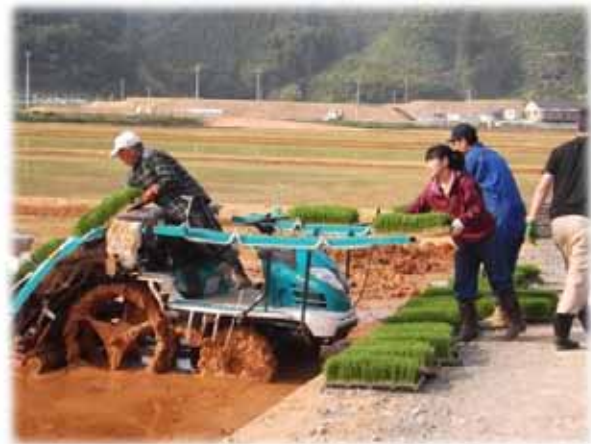
▲写真 南三陸地区 田植え状況 (H28年5月)