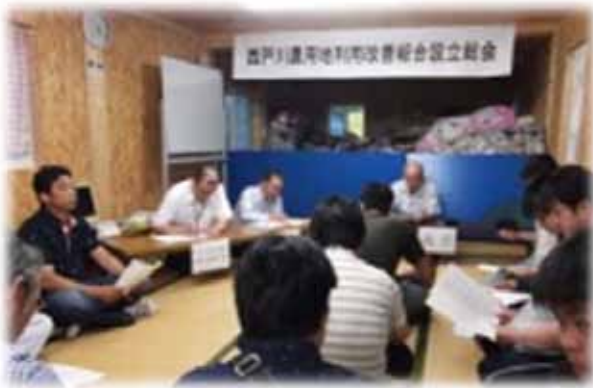
▲写真 西戸川(農用地利用改善組合設立総会) (H24年12月)

さらに、担い手や将来の営農方向等についても、各工区代表者の方々等と十分に話し合いを重ね新たに「営農組合」及び「農用地利用改善組合」が設立され、復旧復興した農地の営農再開に向けた体制を整えた。