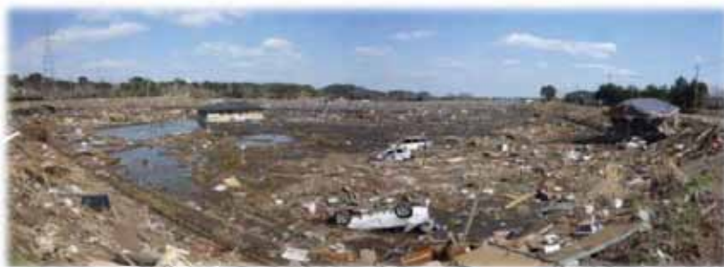
▲写真 被災状況（H23年6月）