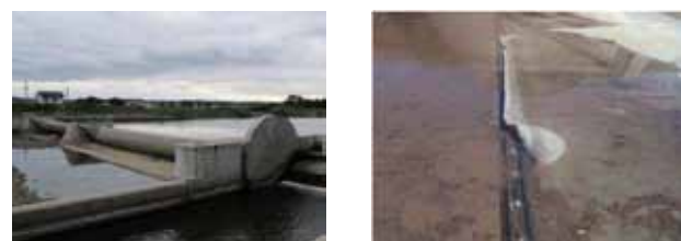
▲写真 県営災害復旧事業 秋山頭首工 栗原市 ゴム堰破損状況