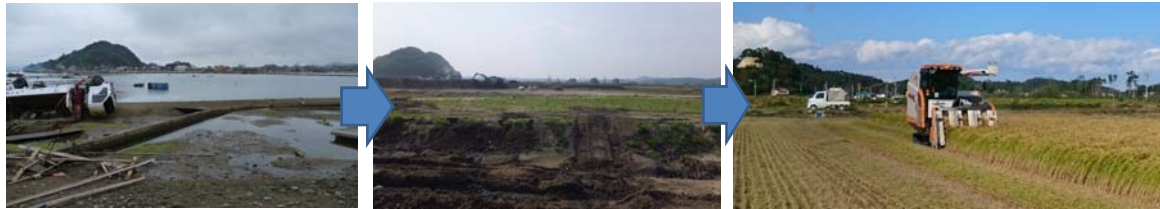
▲写真 県営災害復旧事業(農地)鳴瀬・奥松島地区被災(左)・復旧状況(中)・営農再開(右)(東松島市)