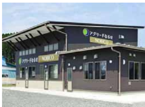
▲写真 アグリードなるせ NOBICO