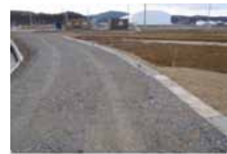
▲写真 波伝谷地区復旧状況 南三陸町

農業用施設については、災害査定申請した217地区について県営及び団体営により施設災害復旧事業により復旧している。