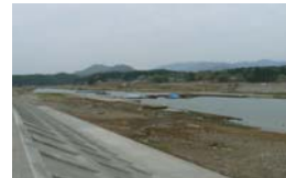
▲写真 県営農業用施設災害復旧事業 十郎衛門頭首工 被災状況(気仙沼市)