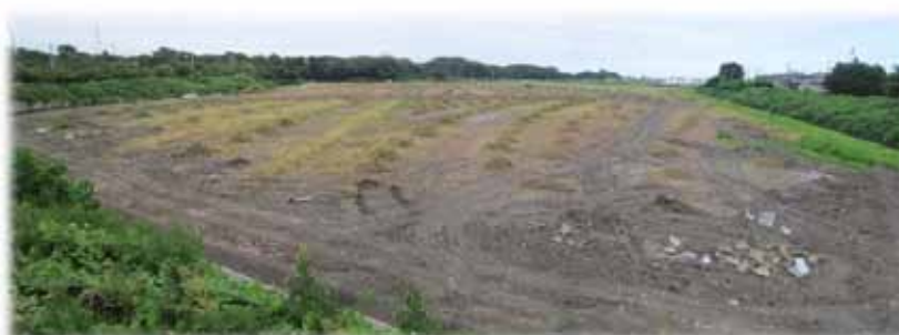
▲写真 工事完了（H27年4月）