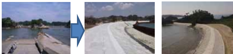
▲写真 農地海岸災害復旧事業 本屋敷海岸被災状況 (左：被災状況 中央・右：復旧完了)

集落排水施設については 23 地区で災害査定申請があり、全ての地区が完了している。