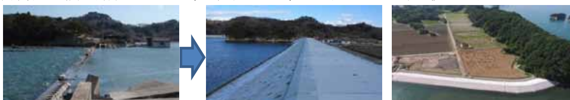
▲写真 県営農地海岸復旧事業 宮戸地区 東松島市（左：被災状況 中央：復旧完了 右：背後地復旧状況）

東部管内の農地海岸については、全長約3.5km、23地区について県で復旧工事を実施している。