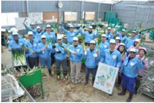
▲写真 井戸生産組合の皆さん（仙台市）