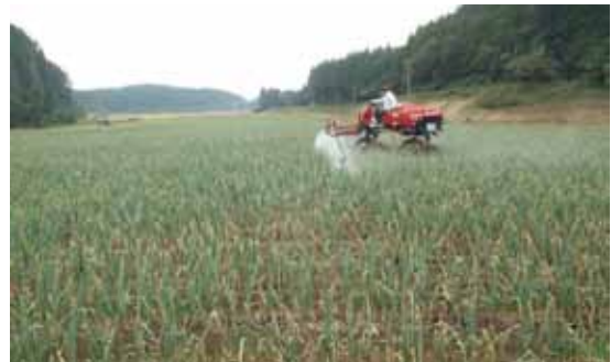
▲写真 在郷工区（南三陸町）のネギ畑