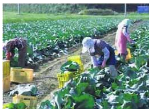
▲写真 鳴瀬地域（東松島市）キャベツ収穫