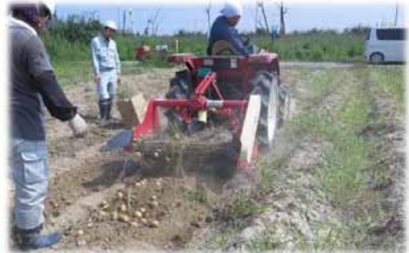
▲写真 山元東部地区 ジャガイモ収穫の様子(H27 年 7 月)