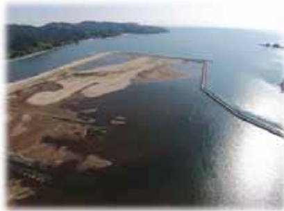
▲写真 長面工区下流部 干陸化に向け排水中(H27年7月)