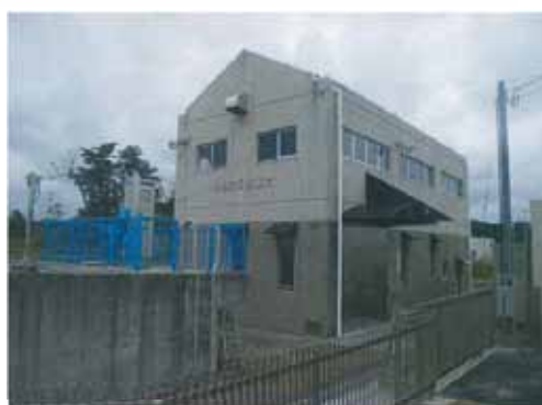
▲写真 復旧完了（H25年3月）