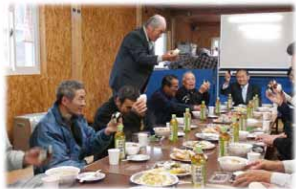
▲写真 西戸川収穫祭(H27年11月)