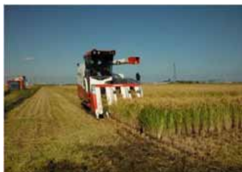
▲写真 井土地域（仙台市）※