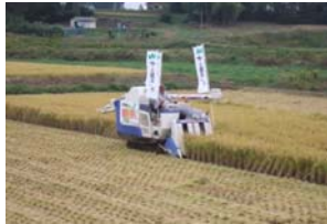
▲写真 沖ノ田地区(気仙沼市)