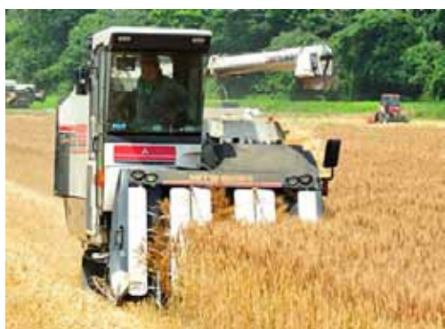
▲写真 鳴瀬地域麦刈取り状況（東松島市）

（参考：アグリードなるせホームページより https://agriead.jp/about#philosophy ）