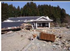
▲写真 団体営農村生活環境施設復旧事業 大沢地区被災状況 気仙沼市