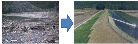
▲写真 県営災害復旧事業(施設)釜谷ため池被災前後(石巻市)