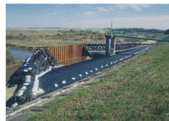
▲写真 県営災害復旧事業(施設)不來内排水機場地区(松