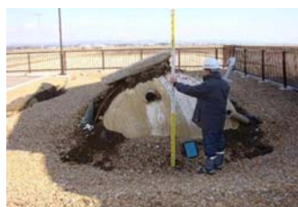
▲写真 団体営農村生活環境施設復旧事業 延滞地区被災状況（登米市）