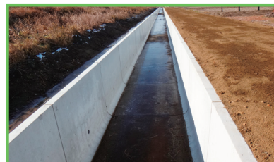
水利施設等保全高度化事業 一般型 (基幹水利施設整備型) 銭神地区

ダム・頭首工・用排水機場・幹線用排水路等、基幹的な農業用排水施設の整備を行い、用水不足の解消や水害防止をはじめとした水利用の安定と合理化により、農業生産性の安定を図るものです。