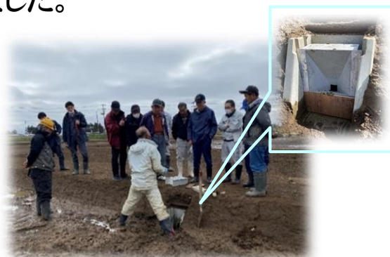
現地見学会▲ (田んぼダム説明)の様子

その後、本地区での導入を予定している田んぼダムについて、古川農業試験場の職員が新型ロート型堰板の使用方法を説明しました。地権者に田んぼダムの効果や必要性を理解してもらい、洪水被害を軽減する重要な取組としてご協力いただくこととしております。