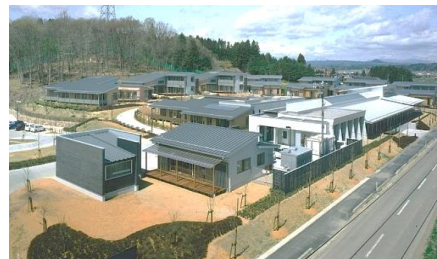
入所施設全景（栗原市金成）

障害のある方やそのご家族、職員が「共に幸せに生きる」ために、それぞれの施設で様々な活動の支援を行っています。