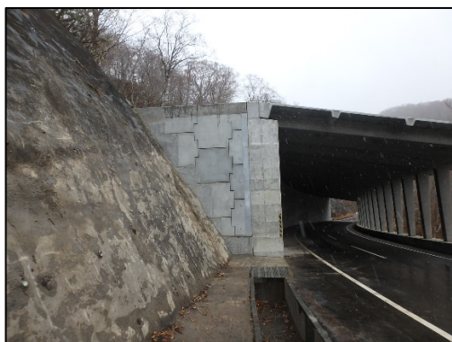
なだれ沢スノーシェッド完了