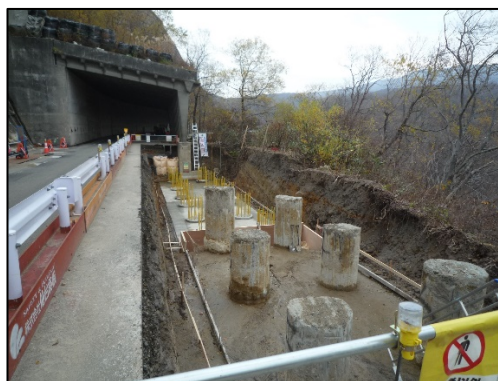
湯浜1号スノーシェッド施工状況