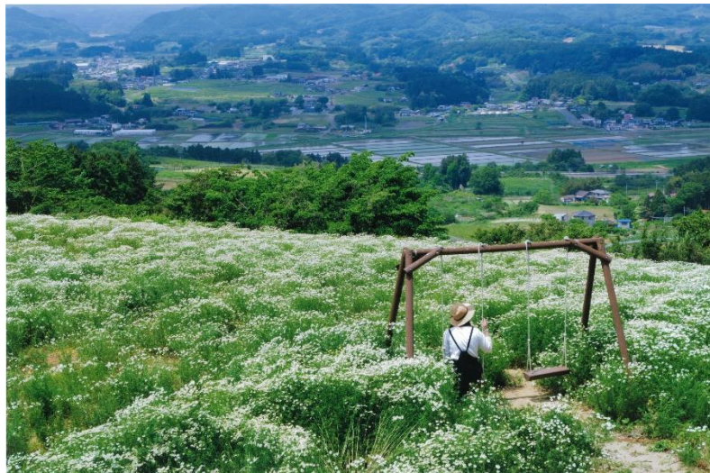
【第10回みやぎのふるさと農美里 のんびり フォトコンテスト(R4)】