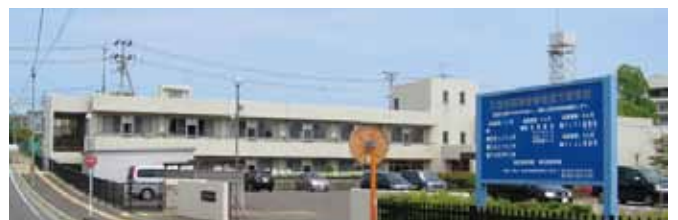
JCHO 仙台病院 (旧社会保険病院)