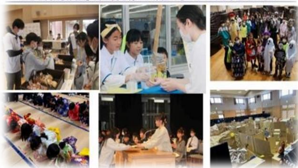
「こども実行委員会」郷土愛を育み、素直で思いやりある子どもたちに

自己肯定感、自己有用感を高めて子供たちを学校へ送り出したいと考えています。また、自分の地域で郷土愛を育み、スポンジのようにどんどん吸収する素直で思いやりのある子供たちに育てほしいという思いで活動しています。地域の職業を体験するために、地域の会社の事業所の皆さんにご協力いただいた職業体験とか、子供たちがレモネードを販売して、200円、300円の代金を頂戴し、小児がんの子供たちに寄付をするという寄付活動を実施しました。また、郷土愛を培うために日本の和装文化を経験することや、子供実行委員会主体で、子供作品展、絵画と書写の作品展の表彰式を行いました。子供たちが自分で審査をして賞状を渡すという活動をしています。この時は、担任の先生が協力してくださり、司会は担任の先生にお願いしました。子供たちが自分たちでやりたいこと、「こういうことをやってみたい」「こういうことを考えている」という気持ちを、私たち大人がもらって活動しているものです。やはり地域の皆さんも一緒にいて、地域を巻き込んでいくということも大切に考えています。