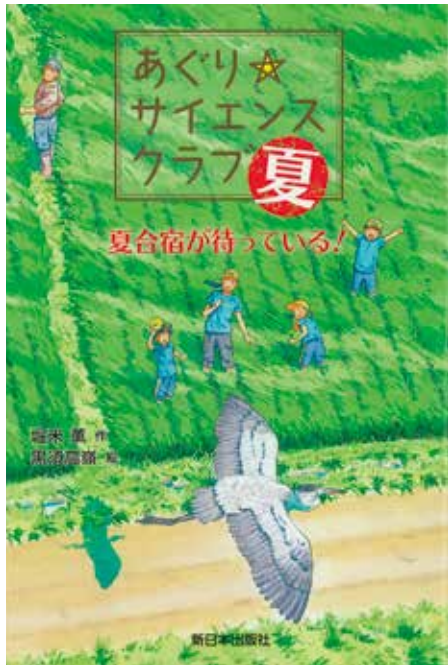
「あぐり☆サイエンスクラブ 夏」堀米薫作 新日本出版社

存じの方も多いのではないのでしょうか。穂が出る前の青々とした田の上を吹き渡るすがすがしい風、まるで波のように揺れる稲の青葉、そして、青田の間を歩む道。とても美しい言葉ですね。子どもたちにも、ぜひ覚えてほしいなと思いました。この言葉を知ること、「ああ、今、青田風が吹いている。美しいなあ!」と、夏の田んぼを見る目が変わったらしいです。