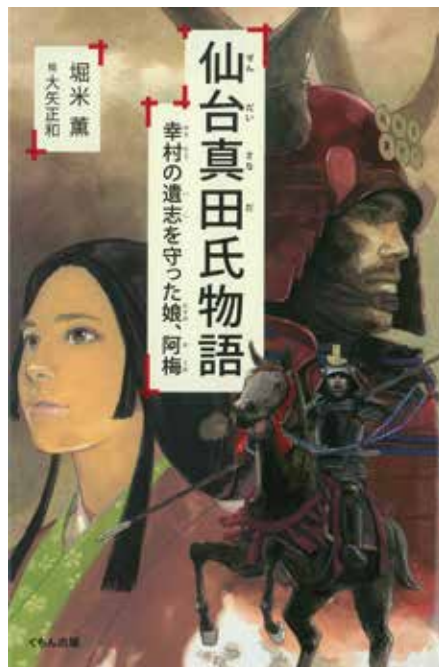
「仙台真田氏物語」 堀米薫作 くもん出版

敵将の男子をかくまえば、リスクはさらに大きかったはずですが。大八は、片倉守信と名前を変えて仙台藩士となり、その血筋は片倉家の親せき筋として、幕末まで仙台藩のために尽くしたといわれています。鬼小十郎との間に子供がなかったため、