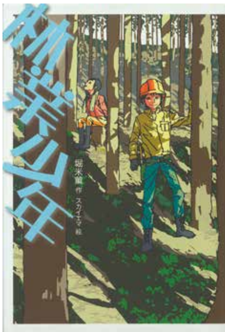
「林業少年」 堀米薫作 新日本出版社

日、祖父のもとに、直接交渉して値段を決める「相対取引」のお客が来たことで、一家に変化が訪れます。喜樹をはじめ、一家がそろうて百年杉の伐採を見届けることになりました。喜樹は木こりたちから、「栗は土台に、山桜は上がり框に使うといいぞ」などと、木についての知識をさずけられます。また、百年先を見