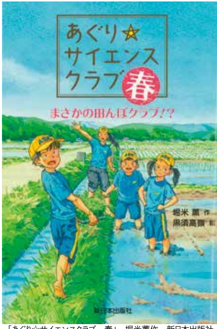
「めぐり☆サイエンスクラブ 春」 堀米薫作 新日本出版社

然を観察しているの、雲の形や空気の流れから、天気の変わり目がかかるのです。今は、スマホで何でも調べられる時代ですが、自分の体でわかるってすごいことですよ。それに、スマホや電気がなくなったら、私たちはいったいどうするんでしょう。結局、自分の身についたものこそが一番信じられるような気がします。