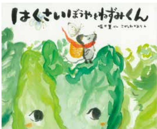
近著「はくさいぼろぼろのきものがたり」 堀米薫ぶん 新日本出版社