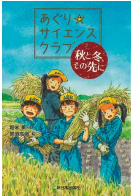
「あぐり☆サイエンスクラブ 秋と冬、その先に」 堀米薫作 新日本出版社

というメッセージを込めました。ある日テレビを見ていたら、稲作を再開したことで、飯館村の農家の方がインタビューを受けていました。飯館村は放射能汚染が深刻で、稲作をあきらめる人も多い状態でした。記者が「なぜ、この土地で、再び田んぼをやるんですか？」と問いかけました。だれでもそう思いますよね。すると農家の方は、「だってな、田んぼはたすきなんだよ」といったのです。静かな口調ながら、万感の思いのこもった声でした。私はそれを聞いて、涙があふれてしまいました。農家の方の思いに、心を強く揺さぶられたからです。