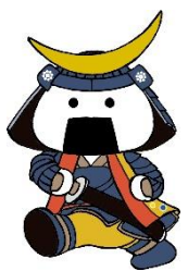
仙台・宮城観光PRキャラクター 「むすび丸」