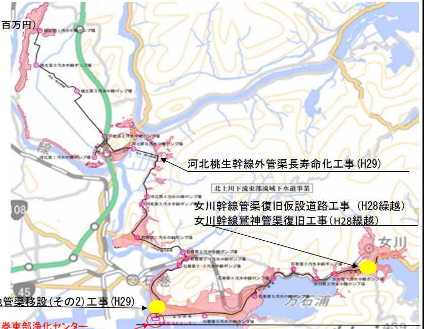
北上川下流東部流域下水道(北上川下流東部処理区)