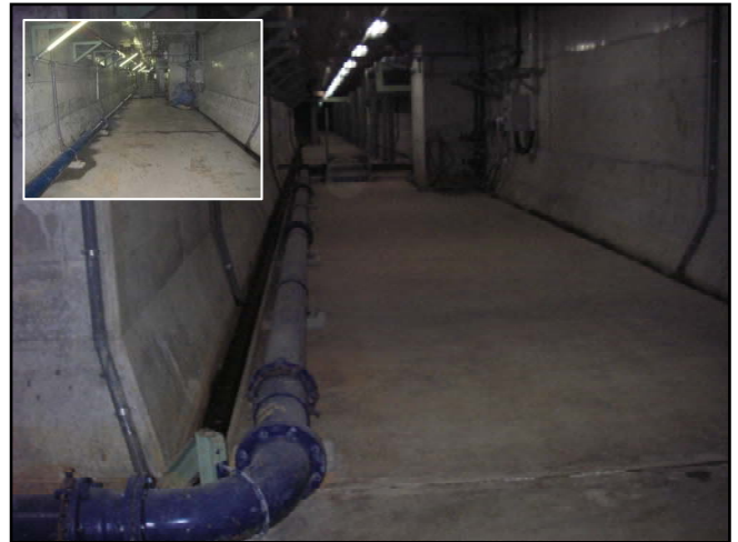
復旧状況（瓦礫撤去・照明器具）