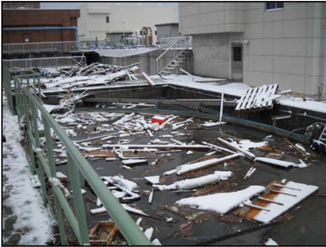
被災状況 (H23.3.17 撮影)