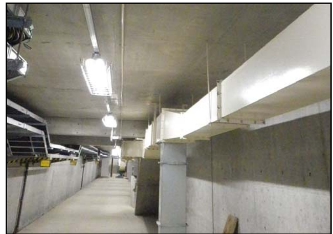
復旧状況（瓦礫撤去・照明器具・換気ダクト）