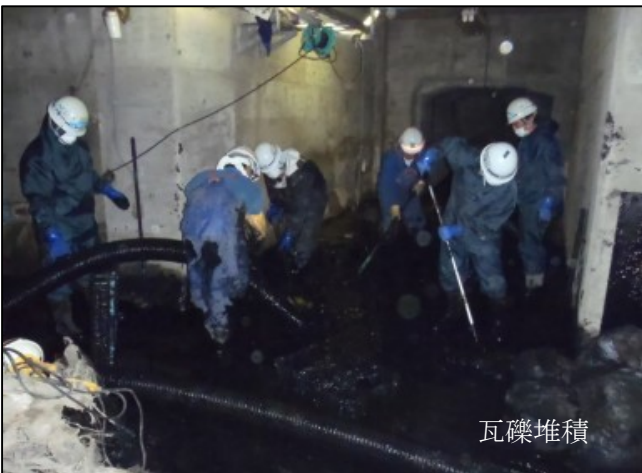
被災状況 (瓦礫等浸入)