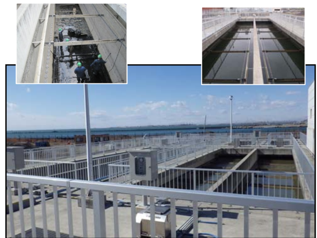
復旧状況（瓦礫撤去・汚泥掻寄機）