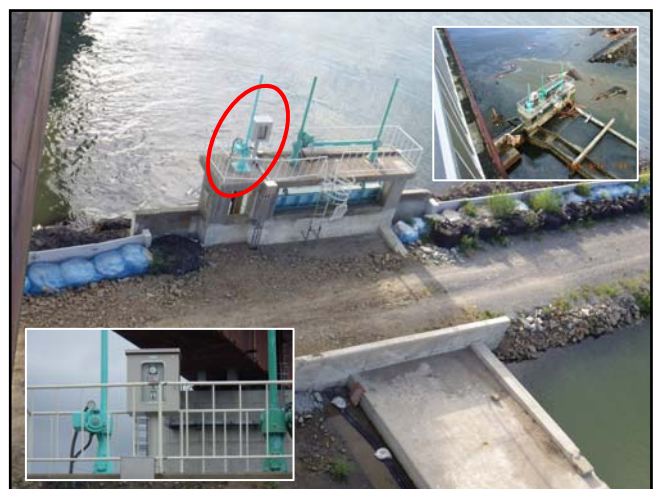
復旧状況（放流ゲート用現場盤）