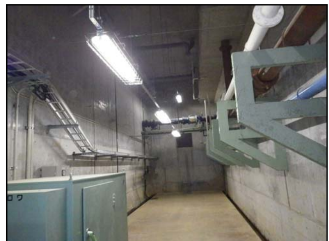
復旧状況（瓦礫撤去・ブロー・照明器具）