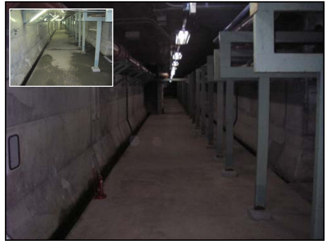
復旧状況（瓦礫撤去・照明器具）