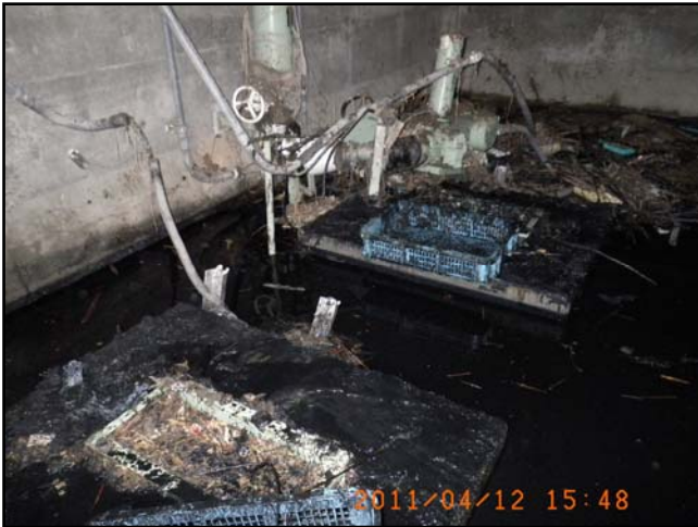
被災状況 (H23.4.12 撮影)