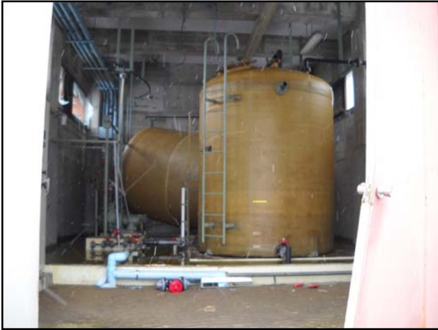
被災状況 (H23.3.17 撮影)