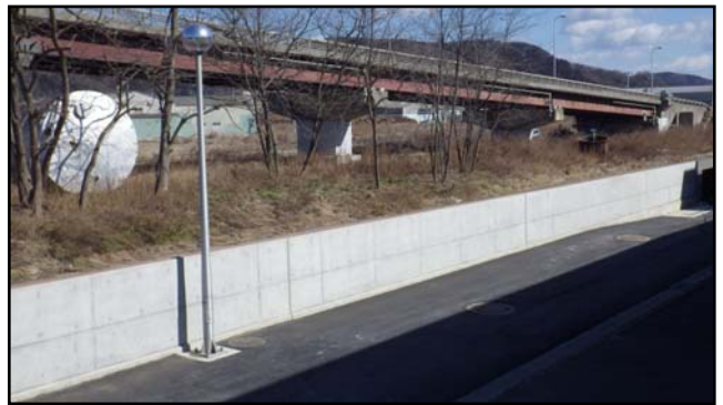
復旧状況 (外灯・外壁・舗装)