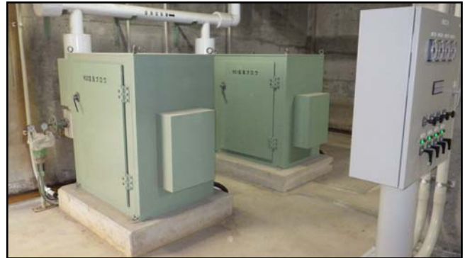
復旧状況 (瓦礫撤去・空洗ブロー・現場盤)