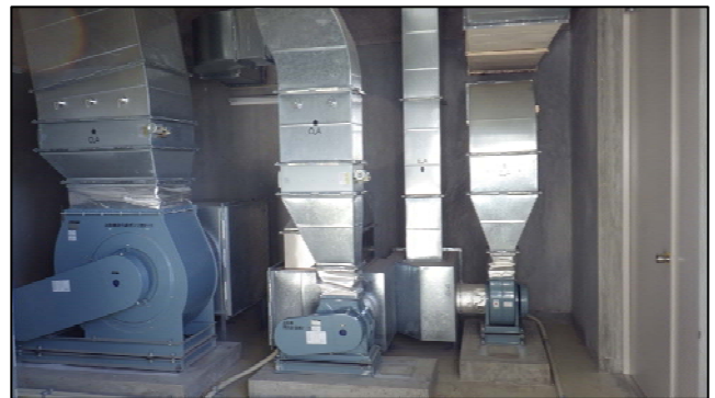
復旧状況（換気ファン・ダクト）