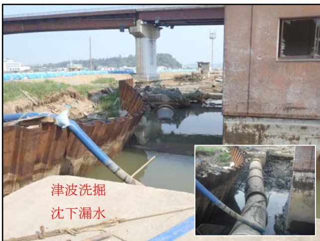
被災状況 (H23.5.20 撮影)