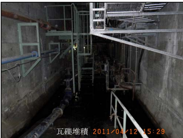
瓦礫堆積 2011/04/12 15:29