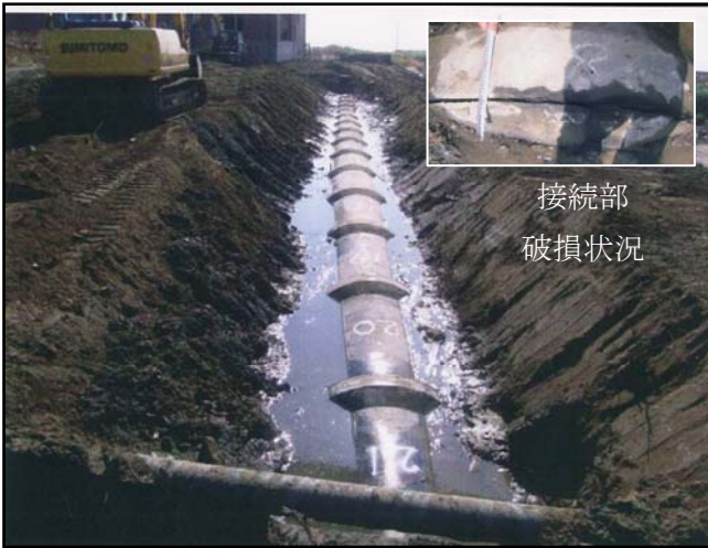
被災状況（破損状況調査）