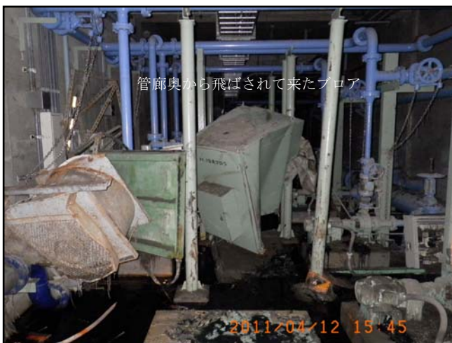
被災状況 (H23.4.12 撮影)