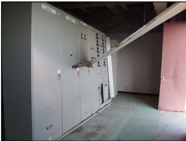
被災状況 (H23.4.12 撮影)