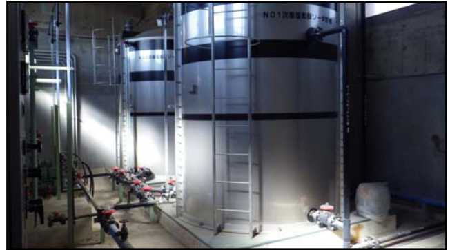
復旧状況 (次亜塩素酸ソーダ貯留タンク・注入ポンプ)