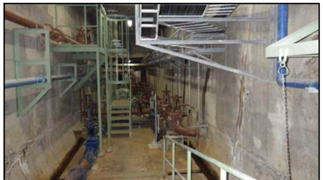
復旧状況 (瓦礫撤去・汚泥引抜弁・照明器具等)