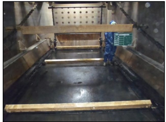
復旧状況（瓦礫撤去）