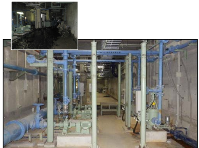
復旧状況 (瓦礫撤去・各種ポンプ)