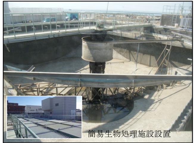
簡易生物処理施設設置