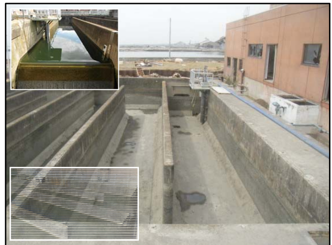
復旧状況（瓦礫撤去・水質測定装置）