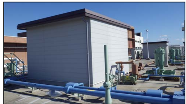
復旧状況（水質測定器室・曝気機）