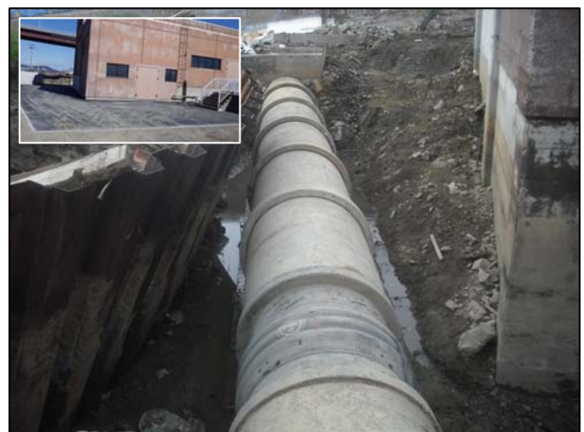
復旧状況 (放流管渠・舗装)