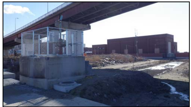
復旧状況（フェンス）