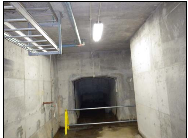
復旧状況 (瓦礫撤去・照明器具)