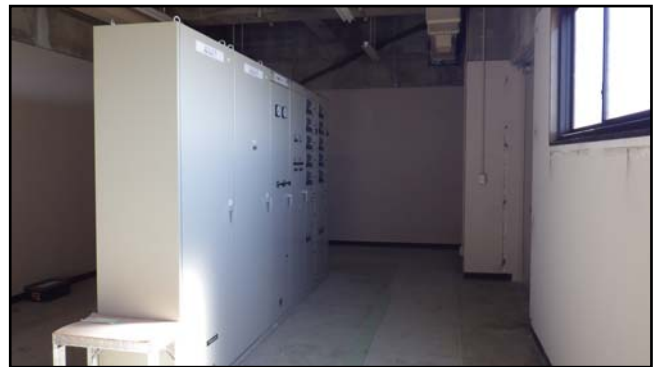
復旧状況 (連動制御盤・コントロールセンタ・扉)