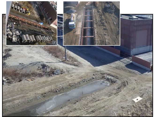
復旧状況（放流管渠）