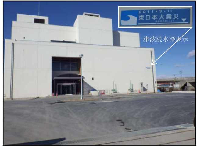
復旧状況（外灯・舗装等）