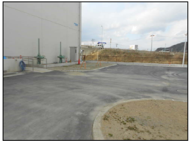
復旧状況（盛土・舗装）