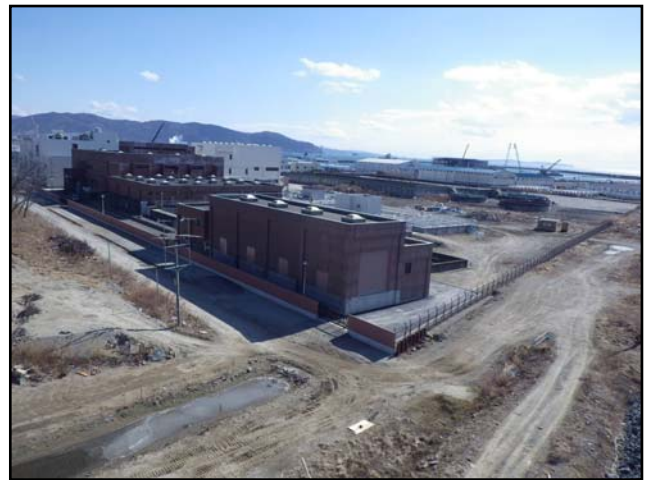
復旧状況 (H25.2.22 撮影)