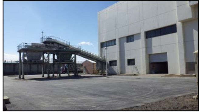
復旧状況 (脱水ケーキョップ・舗装等)