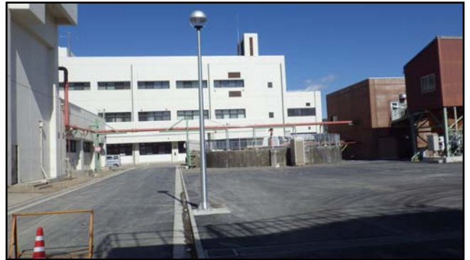
復旧状況 (汚泥脱臭配管・舗装等)