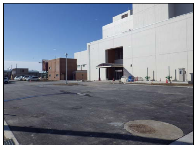
復旧状況（盛土・舗装）