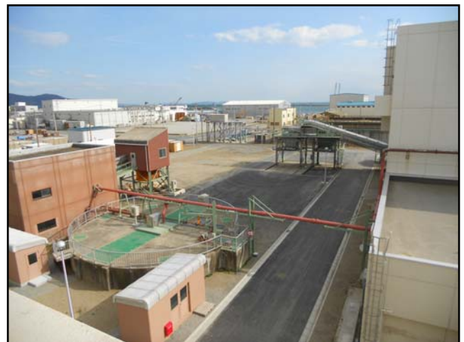
復旧状況（重力濃縮槽・油倉庫・舗装等）