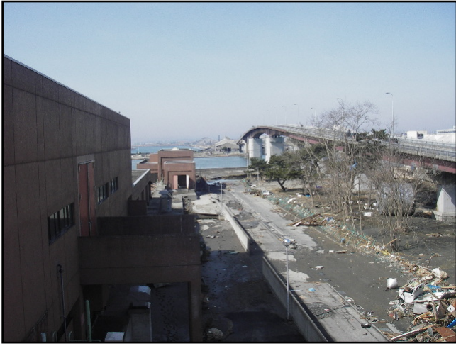
被災状況 (H23.3.14 撮影)