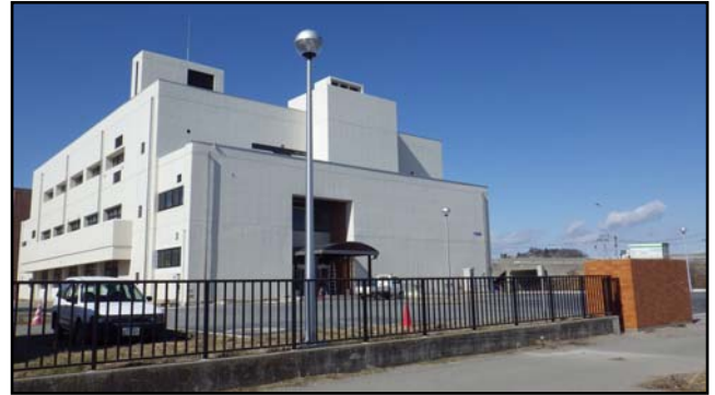
復旧状況（外灯・フェンス）