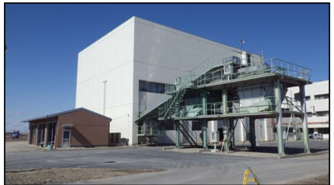
復旧状況 (脱水ケーキョップ・車庫等)