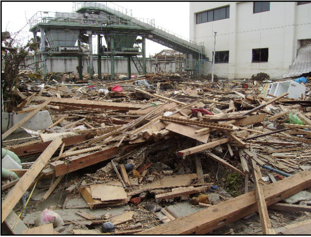
被災状況 (H23.3.22 撮影)