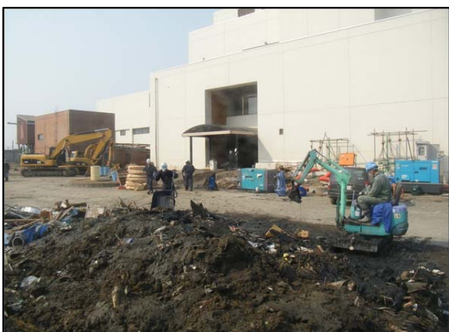
被災状況（室内瓦礫人力撤去状況）