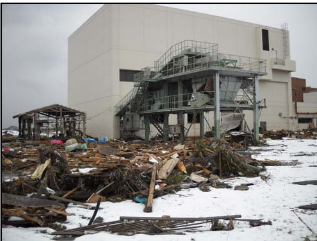
被災状況 (H23.3.17 撮影)