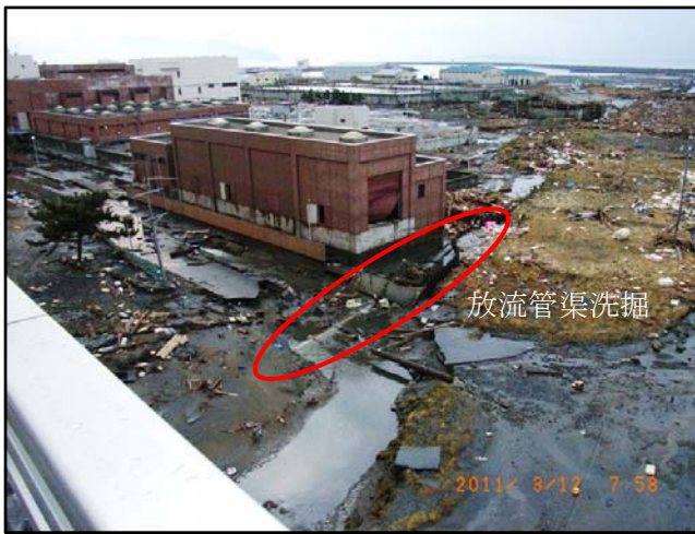
被災状況 (H23.3.12 撮影)