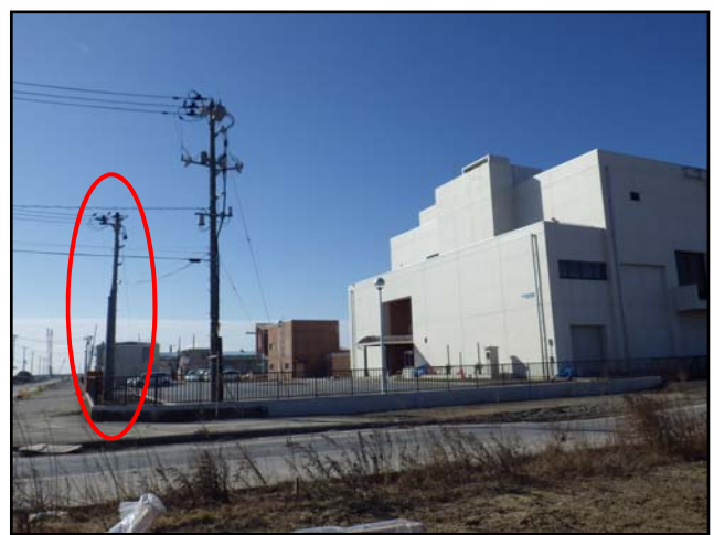
復旧状況 (電力柱・外灯・フェンス等)