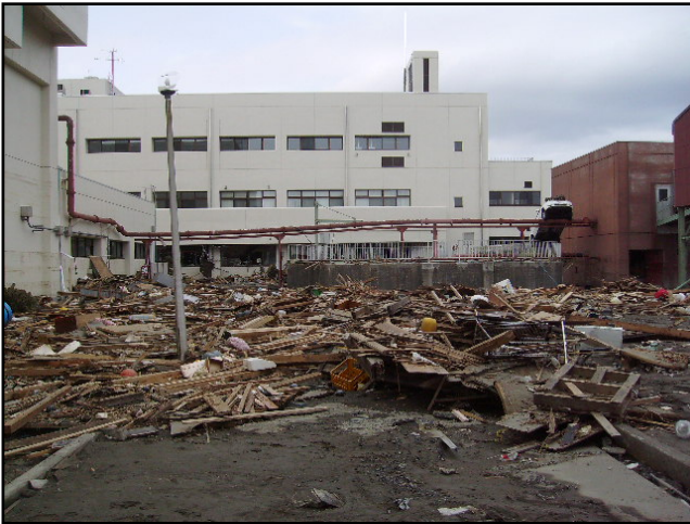
被災状況 (H23.3.22 撮影)