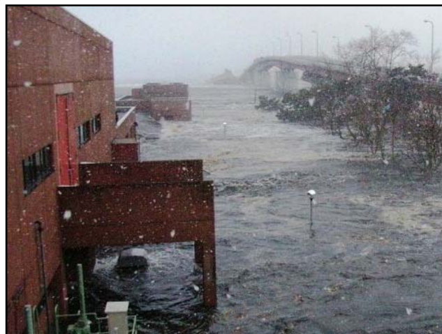
石巻東部浄化センターを襲う6mの津波（中央管理棟から撮影）