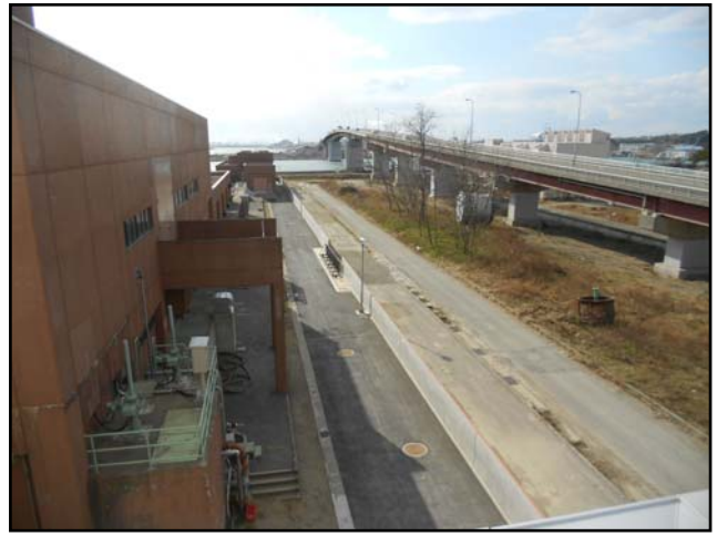
復旧状況 (H25.3.26 撮影)