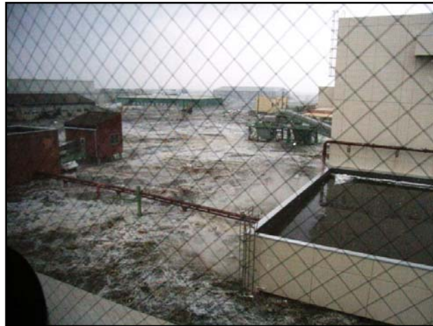
石巻東部浄化センターを襲う6mの津波（中央管理棟から撮影）