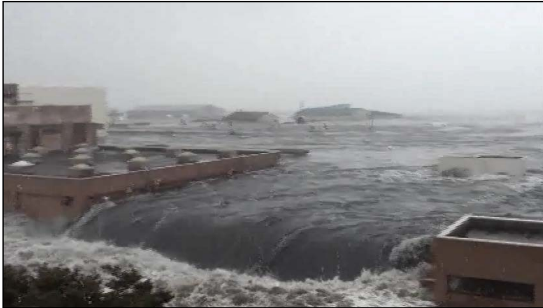
石巻東部浄化センターを襲う6mの津波（日和大橋から撮影）