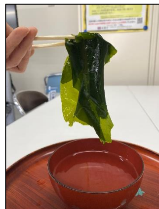
生ワカメ → 湯通し後