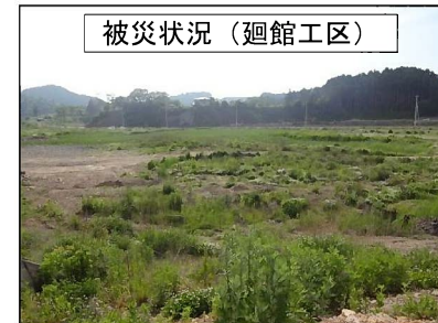
被災状況（廻館工区）