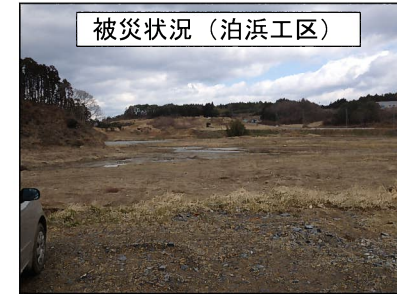
被災状況（泊浜工区）