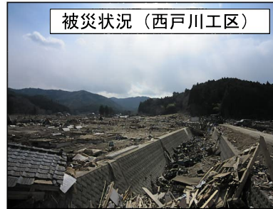
被災状況（西戸川工区）

本地域は南三陸町に位置し、太平洋沿岸部の緩傾斜な水田地帯です。地区内の農地は、現在でも未整理であるため、不整形な区画のうえ道水路は狭小で十分な密度がなく、農家は個別経営を基本とした旧来の営農を継続している状況です。 また、平成23年3月11日発生の東北地方太平洋沖地震による大津波のため、農村地域も壊滅的な被害を受け、農業農村の復旧が急務となっており、地域の復旧については、農地の原形復旧に止まらず、農業生産基盤の復興を確立する必要があります。 このため、農地の区画拡大や道水路の整備を行い、農業機械の大型化や経営体への集約化などの近代的な営農への転換を目指します。