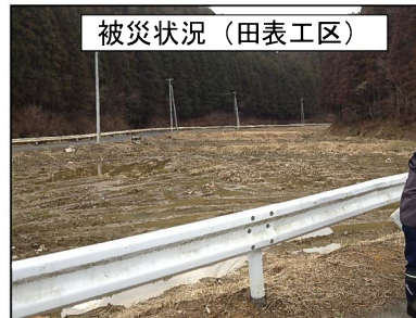
被災状況（田表工区）