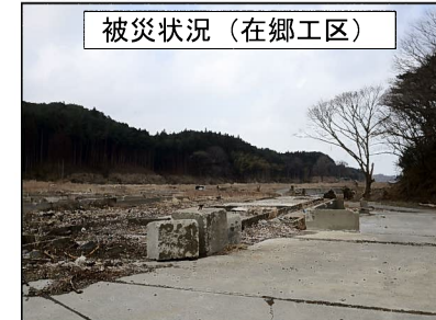
被災状況（在郷工区）