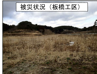
被災状況（板橋工区）