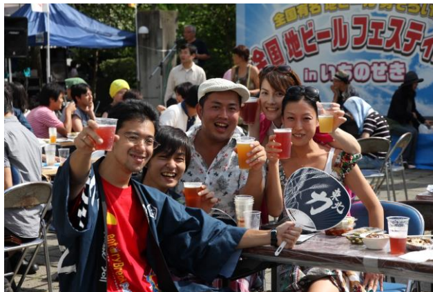
(※過去の地ビールフェスティバル)

全国の主な地ビールが一同に集まるイベントです。今年 21 回目を迎え、日本全国から 200 種以上の地ビールが集まります。