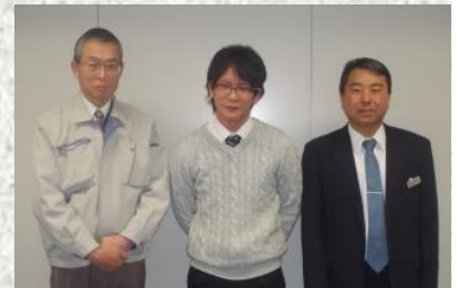
↑一番左が千葉就労支援員

皆さま一人ひとりの日々の積み重ねで、確かに皆様の生活は前進していると思います。私も微力を尽くし、今後も職員と協力して業務に励み、皆様の一助となってまいります。