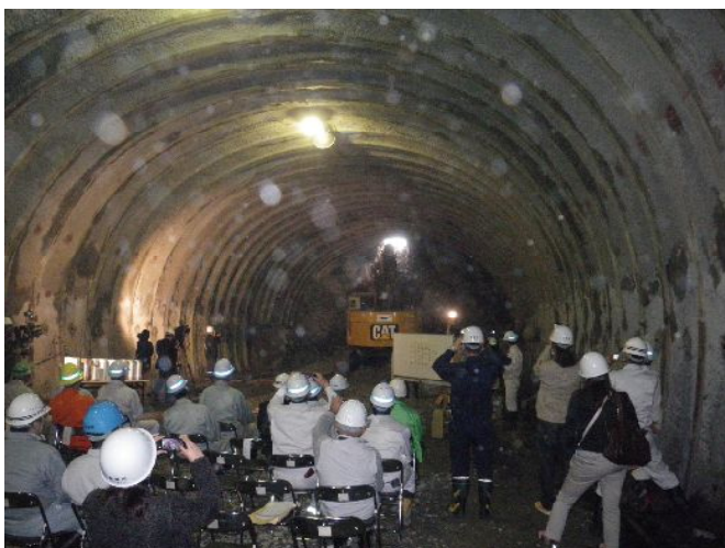
(仮称) 東舞根トンネル貫通

今後は覆工コンクリート及び照明設備等の工事を進め、トンネルを含めた全体工事区間(L=1,780m)についても、平成27年度末の末全線供用開始を目指し、鋭意工事を進めてまいります。