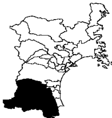
宮城県県南地域位置図

このような地理的条件を活かし、第一次産業では、稲作に偏らない果樹、畜産、特用林産物など多彩な農林畜産業が営まれており、第二次産業では、高速交通網を活用し、電子部品、輸送用機械、生産用機械などの製造業の集積が進んでいる。また、第三次産業としては、豊かな自然環境を活かした観光関連産業など、多様な産業が展開されている。さらに、これまでの温泉、スキー場といった観光資源に加え、蔵王の雄大な自然を有効かつ効果的に活用し、地域産業の振興を図るため、「みやぎ蔵王三十六景」をキーワードにしたさまざまな事業が進められている。