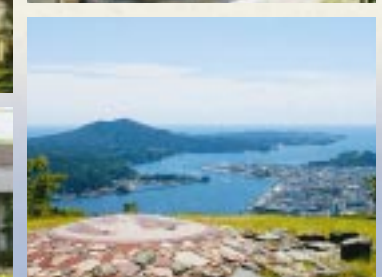
安波山(あんばさん)から望む気仙沼市内の様子 [気仙沼市]