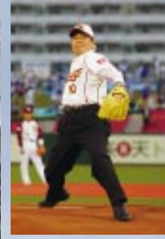
「食材王国みやぎナイト」で始球式を務める村井知事