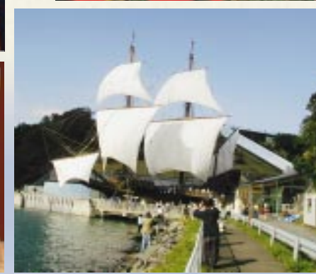
開館10周年を記念し、総展帆を実施したサンファン・パウテスタ