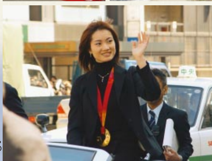
凱旋パレードでファンの声援に応える荒川静香さん(3月27日仙台市内で撮影)