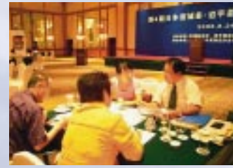
県内企業の海外での経済活動を促進するため、中国大連市で商談会を開催