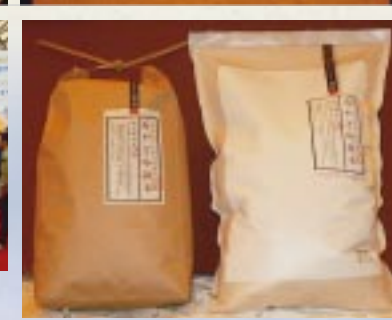
高い基準をクリアした高品質県産米