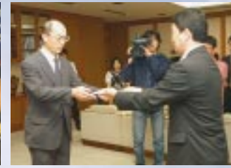
副知事に民間人を起用するのは宮城県初