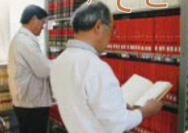
文学を中心にさまざまな分野の本がおかれる

五年、JR瀬峰駅の待合室に本を持ち寄り、文庫を設置し、さらに平成十年には、駅の隣に「駅文庫」を開設しました。その後、この活動に賛同する全国の方から多くの本が寄贈されたため、これらの本を子どもを中心に地域のみなさんに読んでもらいたいという思いから、合併により空きができた市の庁舎を利用した図書館づくりを企画しました。今のところ、「ゆめぼほ」は、土曜日と日曜日のみ開館ですが、ボランティアを募って開館日を増やしていきたい、多くの人が本を利用することで、今後とも豊かな心の醸成と交流の促進による地域づくりを目指していきます。 NPO法人クリンせみね事務局(高橋) 0222(8)582423