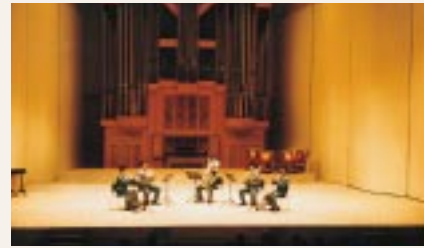
音の響きはこれまで以上、照明もやわらかに

「中新田文化会館」は、バウホールという愛称で地域の皆さんをはじめ、全国の音楽愛好家に親しまれてきました。今年、開館二十五周年を迎えるにあたり、加美町では、三年の期間と約四億七千万円を投じて、音の響きをさらに高める改修やゆりのある客席、照明など館内施設の改修工事を進めてきました。その工事が終了し、七月にリニューアルオープンして以来、さまざま