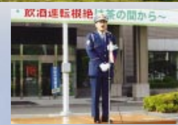
飲酒運転根絶県民大会