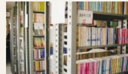
2万冊以上の本が並び

「ゆめぼほ」は、全国から寄贈された本と近隣の築館高校で不要になった本棚を利用してつくられ、現在、文学書を中心に二万冊以上の本がおかれています。本の分類・整理や本棚の運搬は、住民や地元企業の協力で行われ、地域の人々の手によってつくられた、手づくりの図書館といってもよいでしょう。